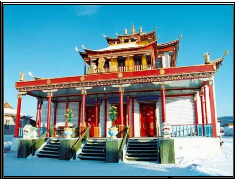
Буддийский храм в Бурятии