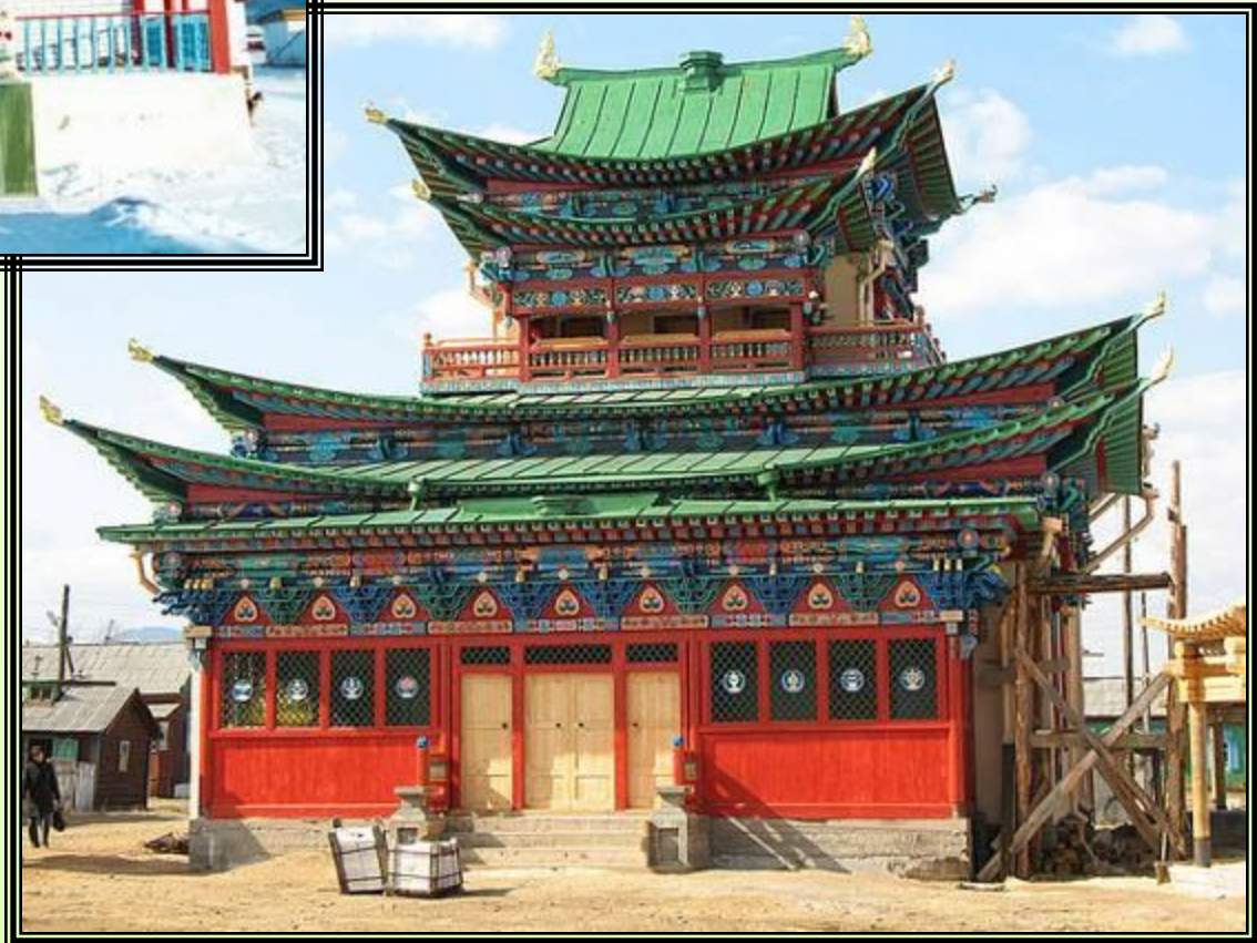
Иволгинский дацан – буддийский монастырь-университет