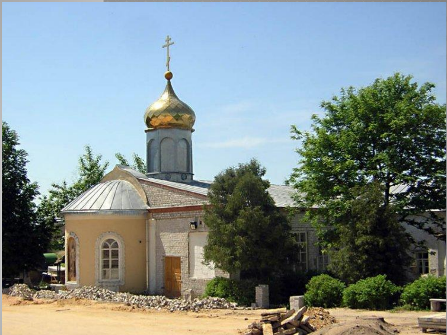
РОЖДЕСТВО - БОГОРОДИЦКИЙ МУЖСКОЙ МОНАСТЫРЬ ЦЕРКОВЬ ТИХОНА ЗАДОНСКОГО