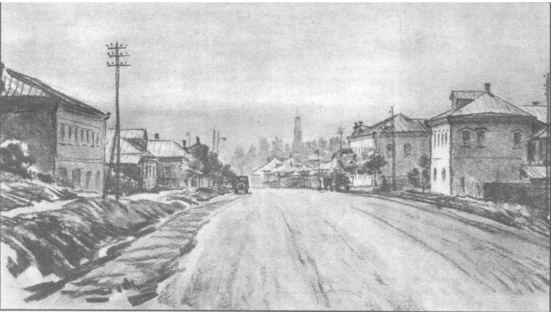
Старая Лопасня. Рисунок С. М. Чехова. Середина 1950-х гг.