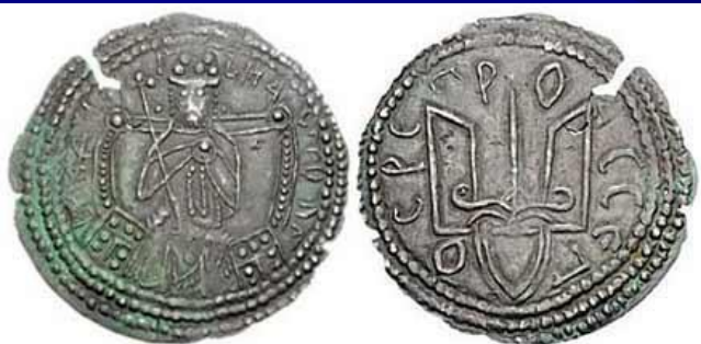
Сребреник Владимира, 980-1015 гг. Серебро, диаметр 26 мм, вес 3.15 гр.