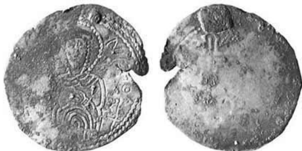
Сребреник Святополка, 1015-1018 гг. Серебро, диаметр 26 мм, вес 2.65 гр.