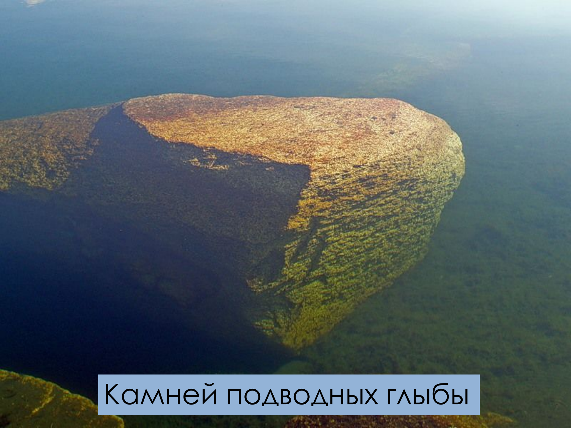
Камней подводных глыбы