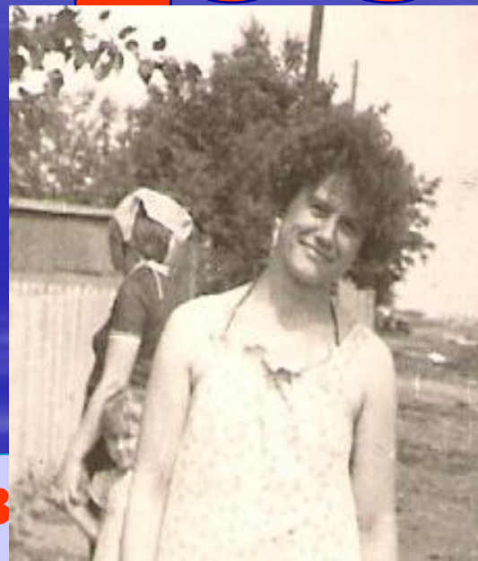
(др. ев Финикова пальма