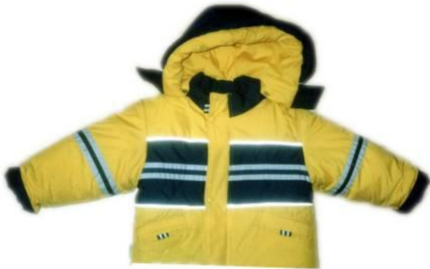
КУРТКА НА МЕХУ ИЛИ ПУХОВИК