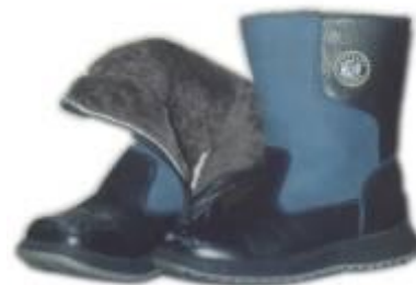
САПОГИ НА МЕХУ