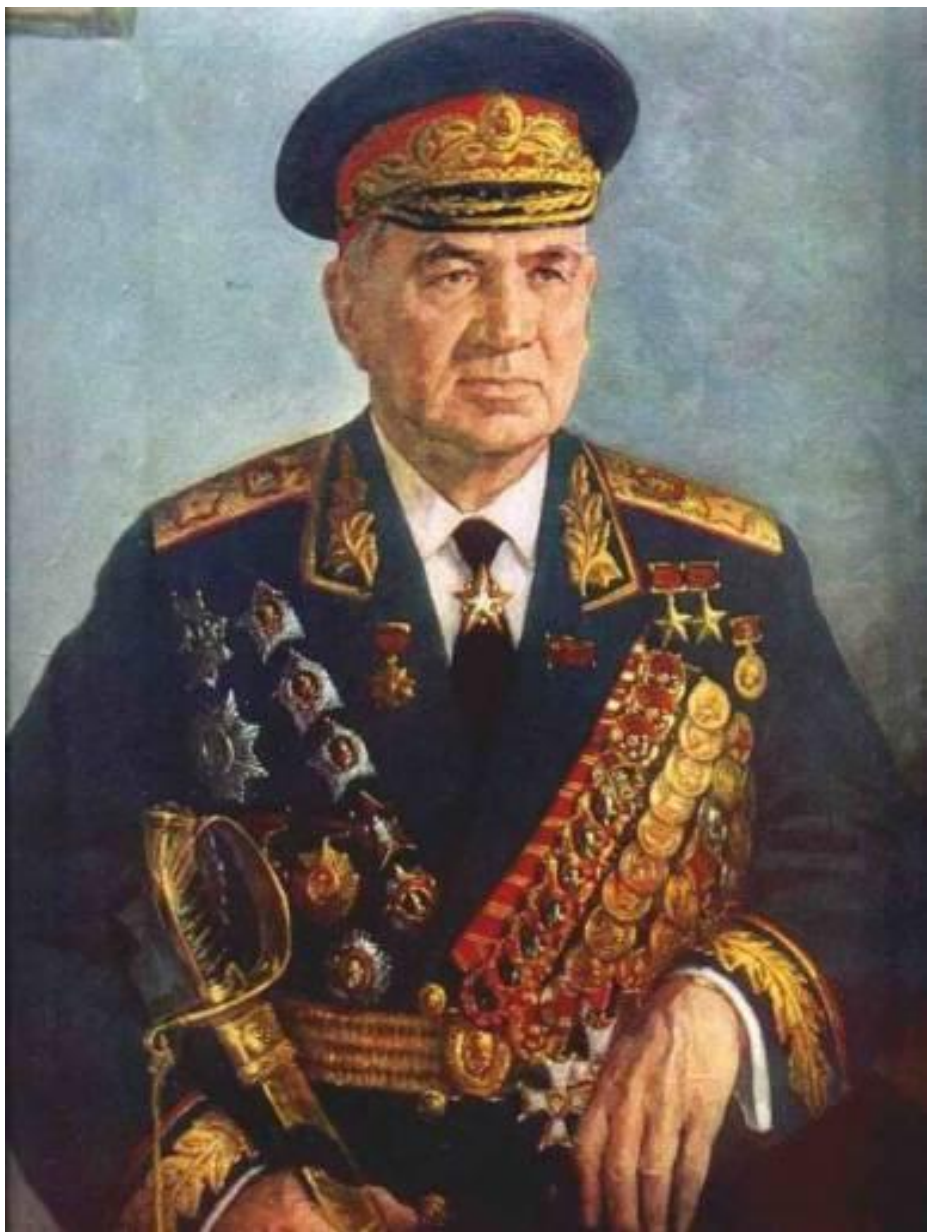
ЧУЙКОВ ВАСИЛИЙ ИВАНОВИЧ