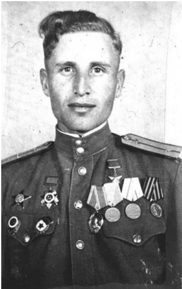
МАТРОСОВ АЛЕКСАНДР МАТВЕЕВИЧ