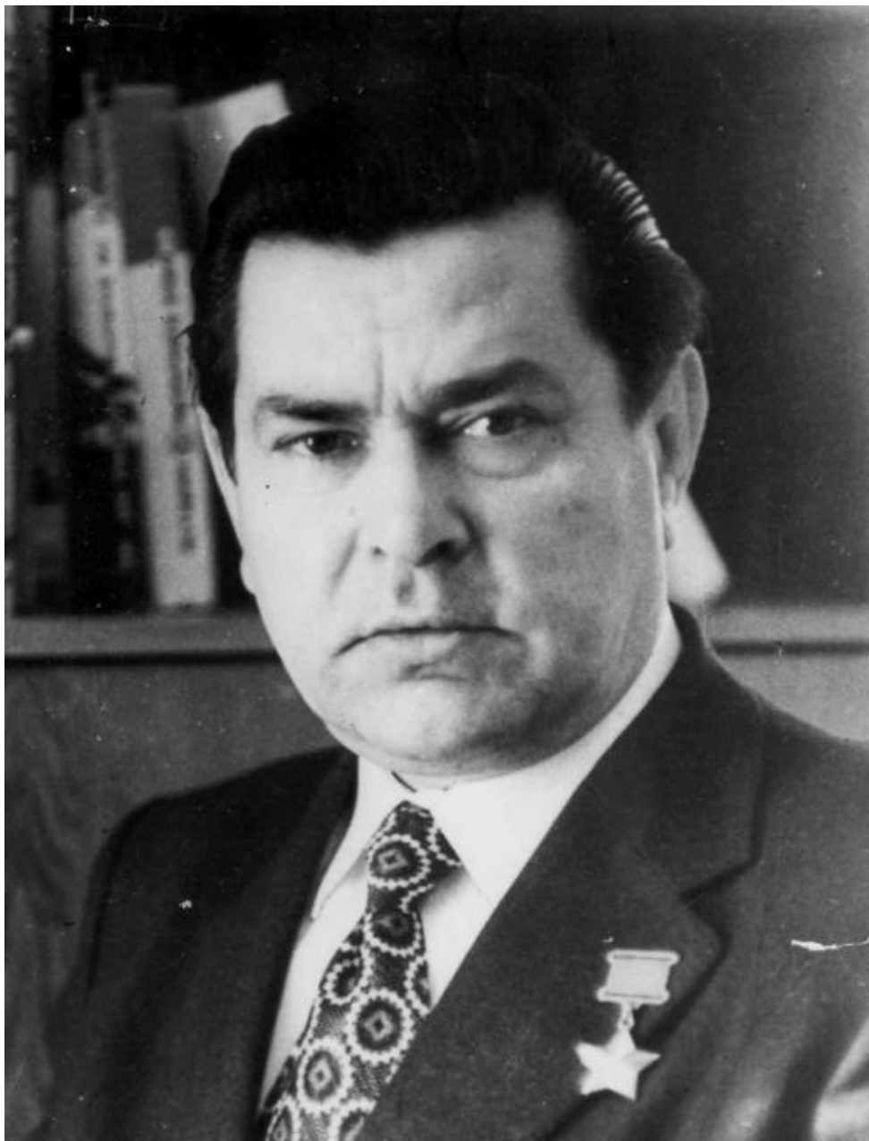
МАРЕСЬЕВ АЛЕКСЕЙ ПЕТРОВИЧ