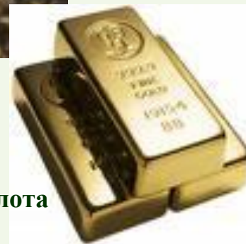
Слитки золота и серебра