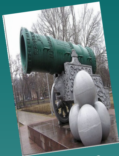
Царь - пушка