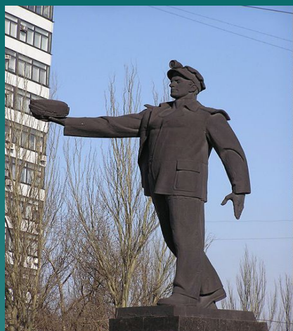
Памятник шахтерскому труду