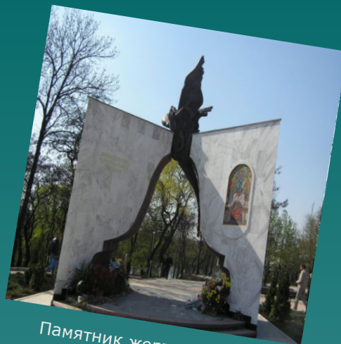
Памятник жертвам черновильской катастрофы