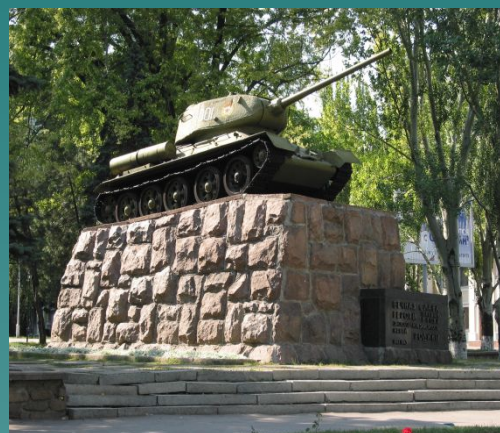
Памятник гвардии полковнику Гринкевичу