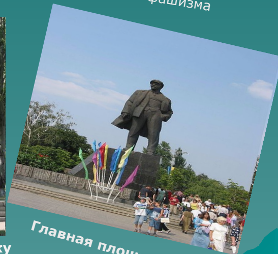
Главная площадь г. Донецка