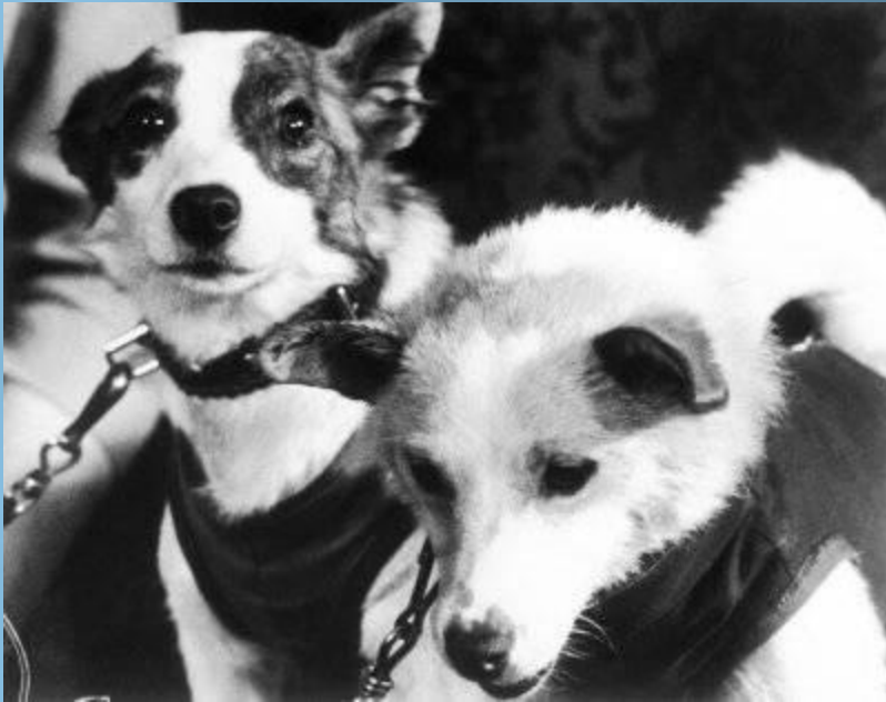
Белка и Стрелка