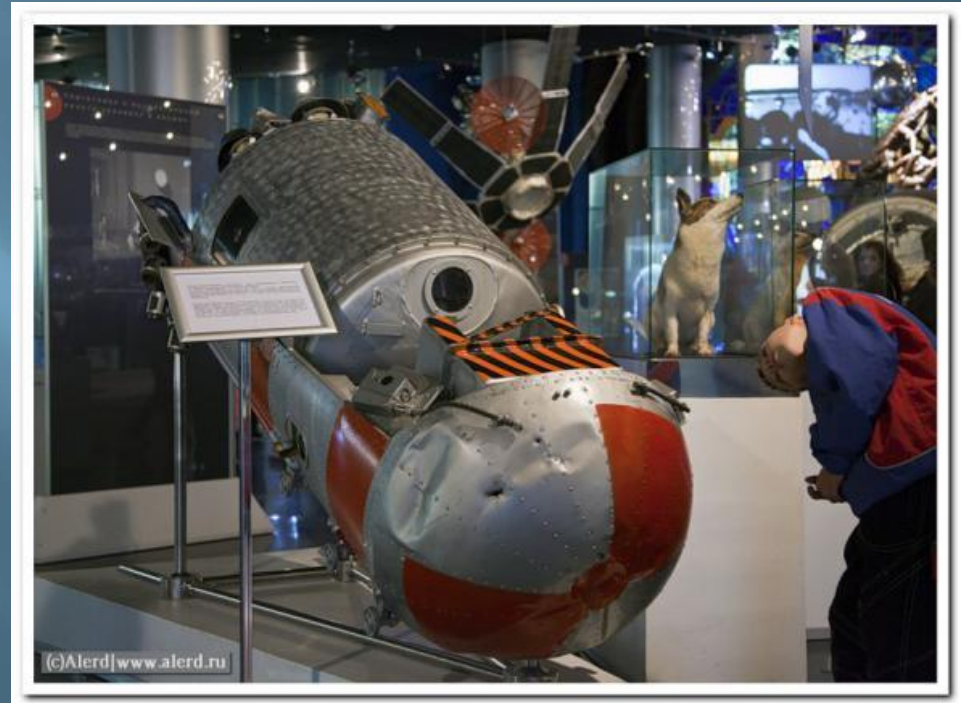
В этой станции летали Белка и Стрелка