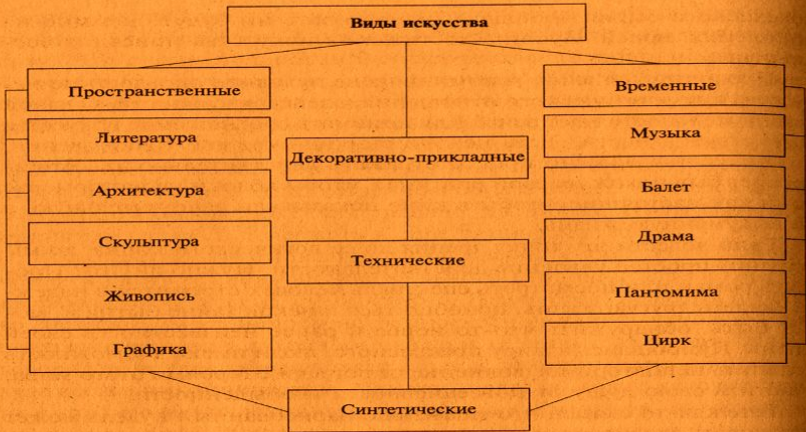
Классификация видов искусства