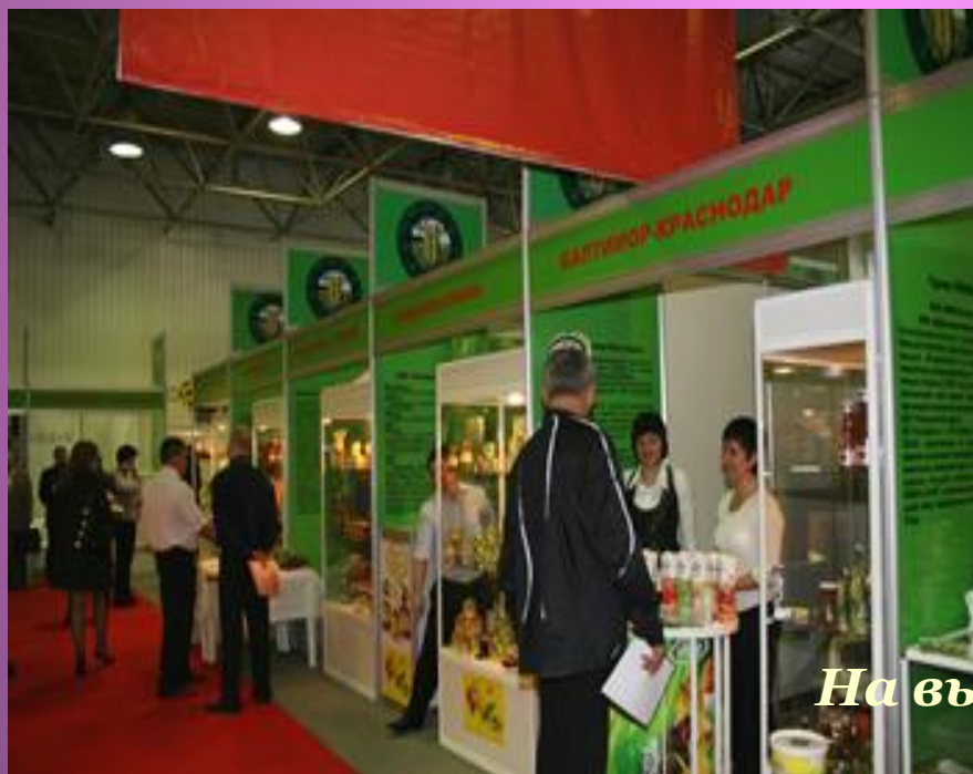
На выставке кубанских товаров

«Я, конечно, не знаю, буду ли я жить завтра, но если я завтра проснусь, то уверен, что прежде всего выпью чая».