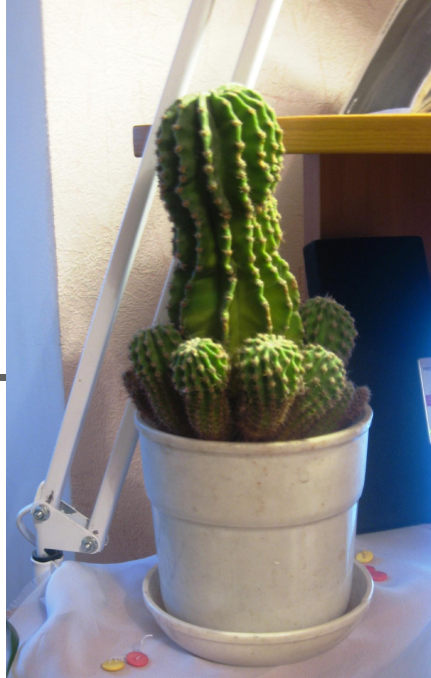
Кактус (мексиканский цереус)