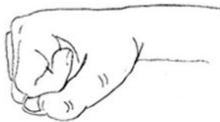
Ладонь, сжатая в кулак

Продолжаем упражнение другой рукой в том же порядке.