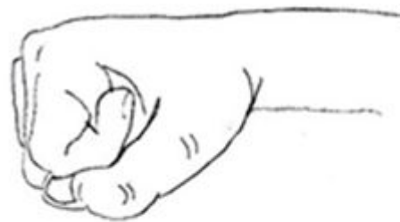
Ладонь, сжатая в кулак

Продолжаем упражнение другой рукой в том же порядке.