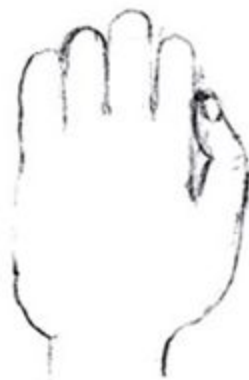
пальцы одной руки сжаты