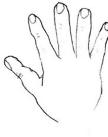
Пальцы другой руки выпрямлены