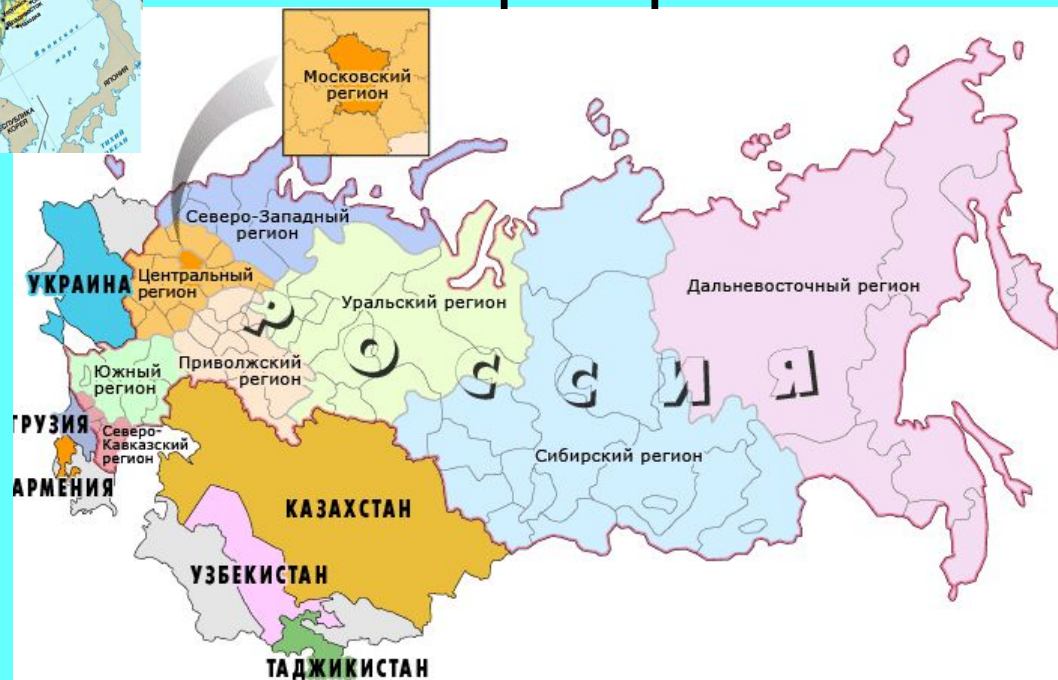
карта стран СНГ

8 декабря в Минске было подписано соглашение о создании СНГ, а вскоре к Содружеству присоединилось большинство союзных республик, подписавших 21 декабря Алма-Атинскую декларацию