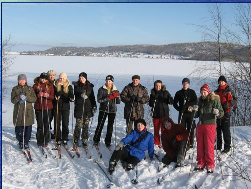
зимняя полевая практика «Зоология беспозвоночных»

На кафедре студенты выполняют курсовые и дипломные работы, материал для этих работ собирается в экспедициях (территория всей Карелии).