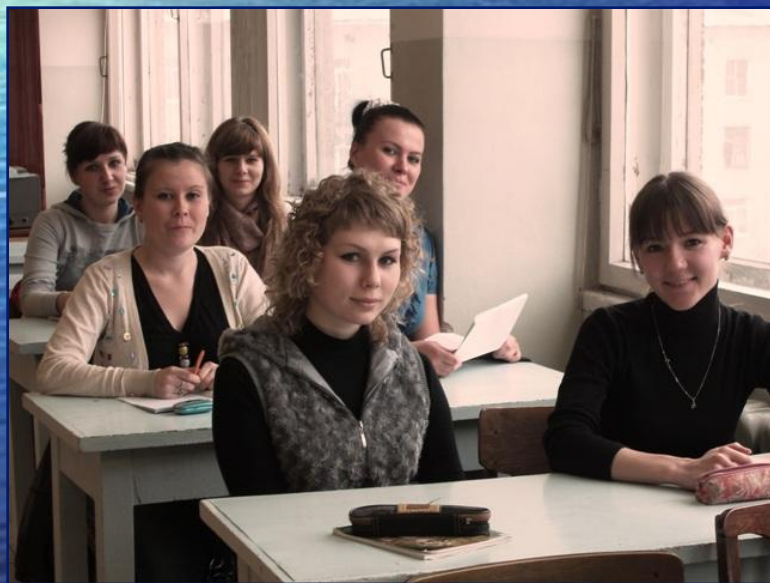
Лекция «Химия природных вод»

Студенты старших курсов выполняют дипломные работы по различным темам на базе кафедры, института водных проблем Севера, КНЦ РАН института биологии.