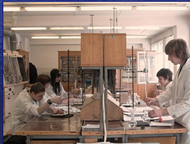
Лабораторная работа «Аналитическая химия»