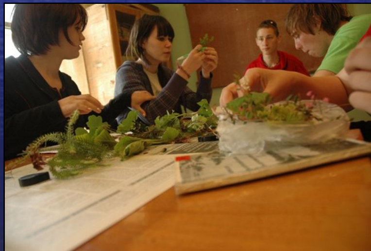
Летняя полевая практика по ботанике