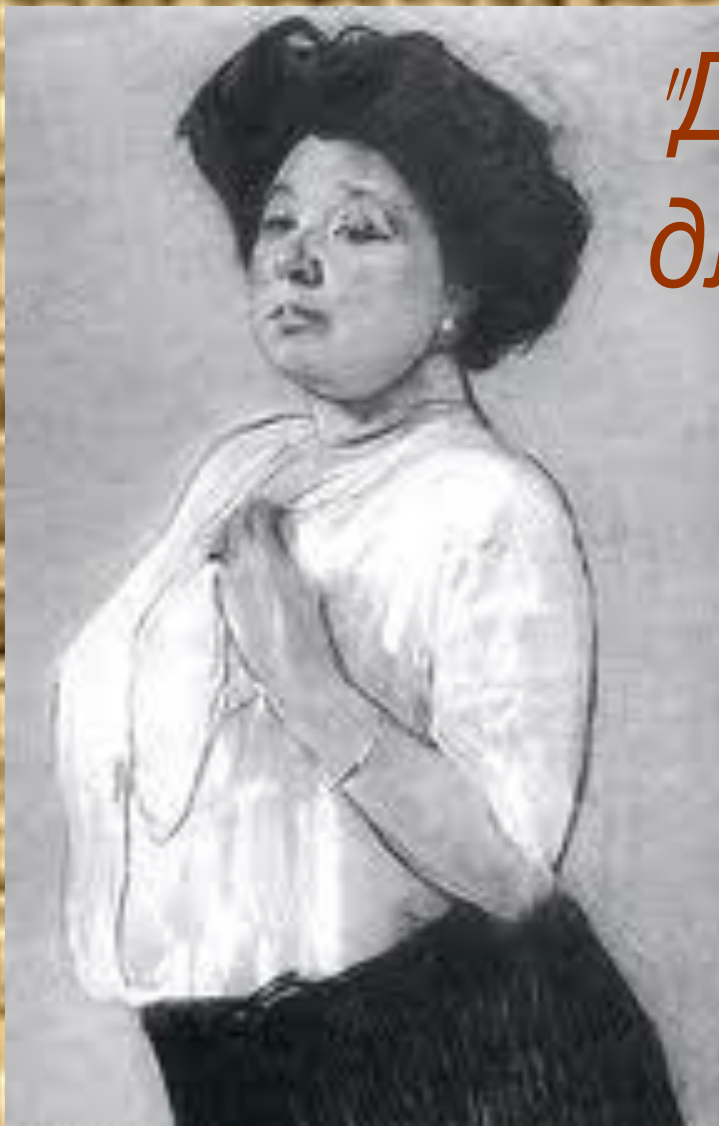
Надежда Петровна Ламанова (1861- 1941г.г)

"Для чего создается к для кого, из чего"