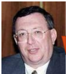
В.А. Гусинский НТВ

Банкротство НТВ, кадровые перестановки в ОРТ