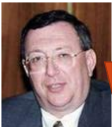
В.А. Гусинский НТВ

Банкротство НТВ, кадровые перестановки в ОРТ