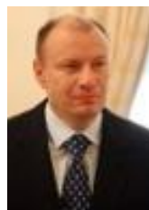
В.Потанин Интеррос $ 17,8 млн.