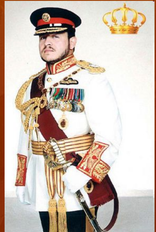
Король Иордании Абдалла 2