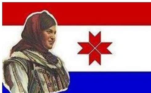
«Я чё, хуже русскому?»