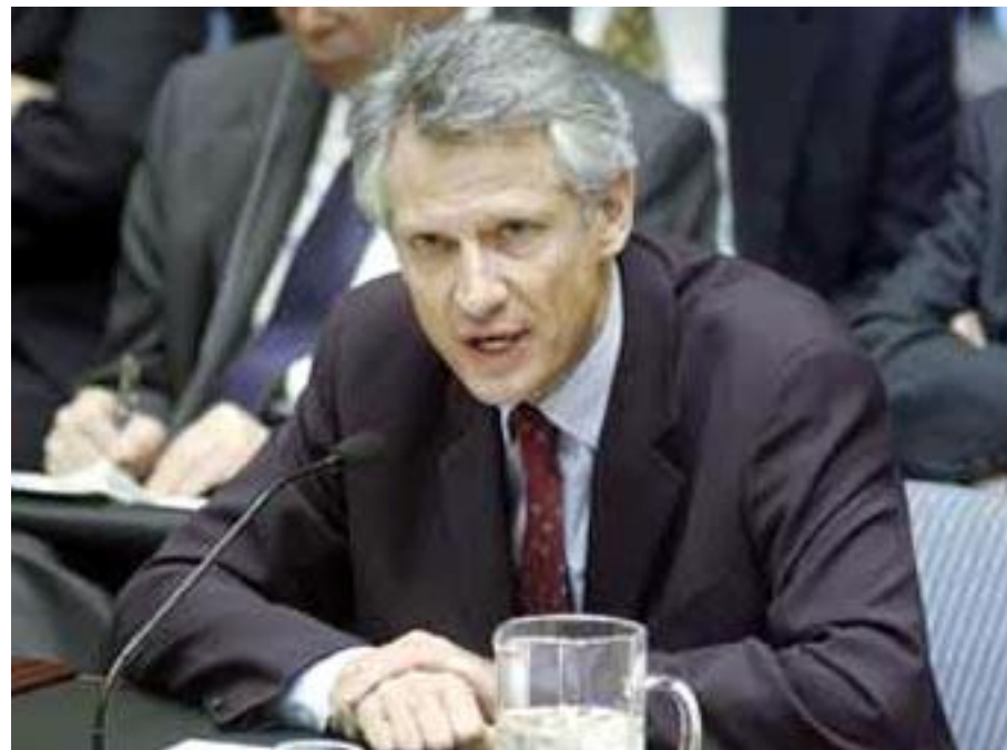
Доменик де Вильпен, Премьер - Министр Франции