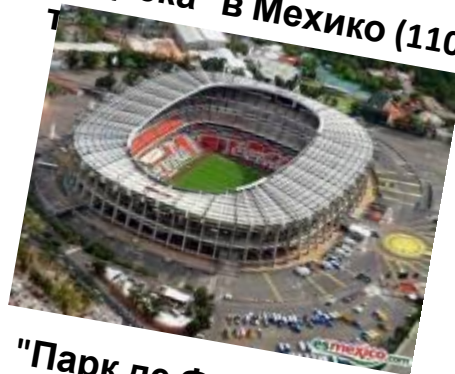
"Ацтека" в Мехико (110 тыс.)