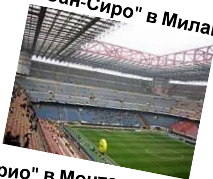
"Сан-Сиро" в Милане (79 тыс.)