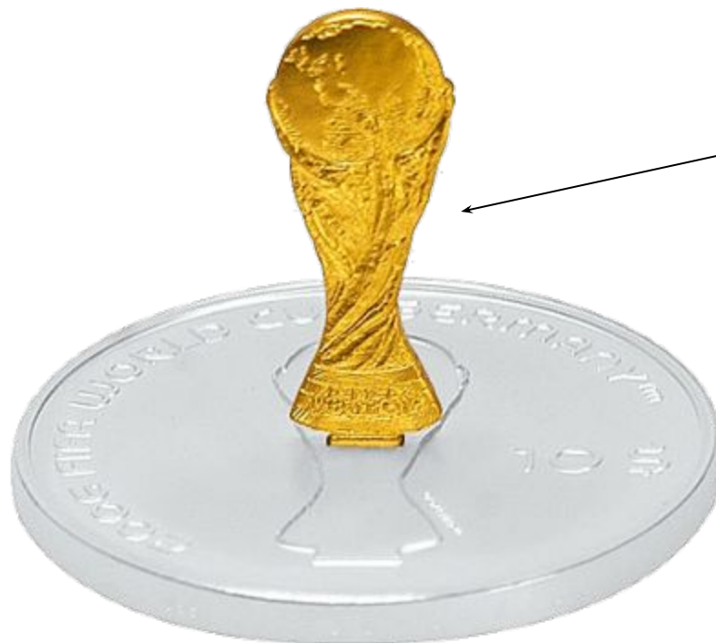
Кубок Чемпионата мира по футболу

Чемпио́нат ми́ра по футбо́лу (часто называемый также Ку́бок ми́ра по футбо́лу, Чемпио́нат ми́ра ФИФА, мундиáль (от исп. Copa Mundial de Fútbol ), официальное название — Ку́бок ми́ра ФИФА ) — международное соревнование по футболу. Чемпионат мира проводится управляющим органом мирового футбола ФИФА, и участвовать в нём могут мужские национальные сборные всех стран-членов ФИФА.