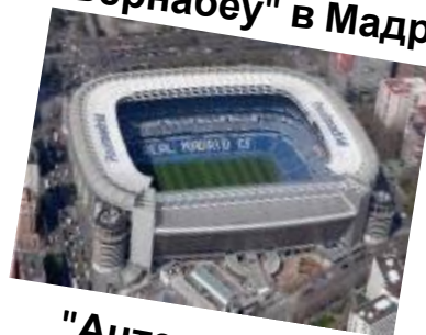
"Сантьяго Бернабеу" в Мадриде (ок. 90 тыс.)