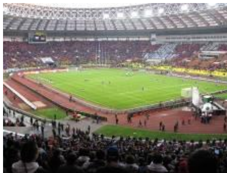
"Лужники" в России (ок. 100 тыс.)