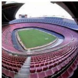
"Ноу Камп" в Барселоне (84 тыс.)