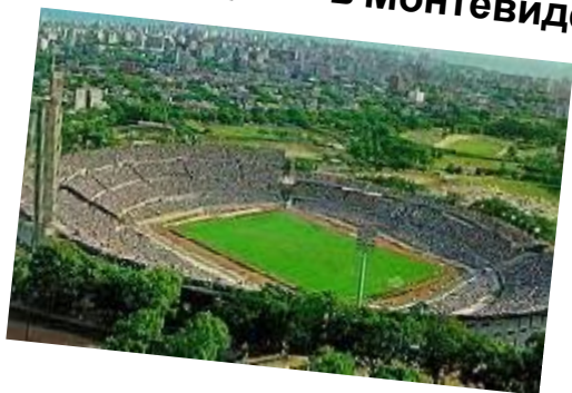
"Сентенарио" в Монтевидео (ок. 75 тыс.)