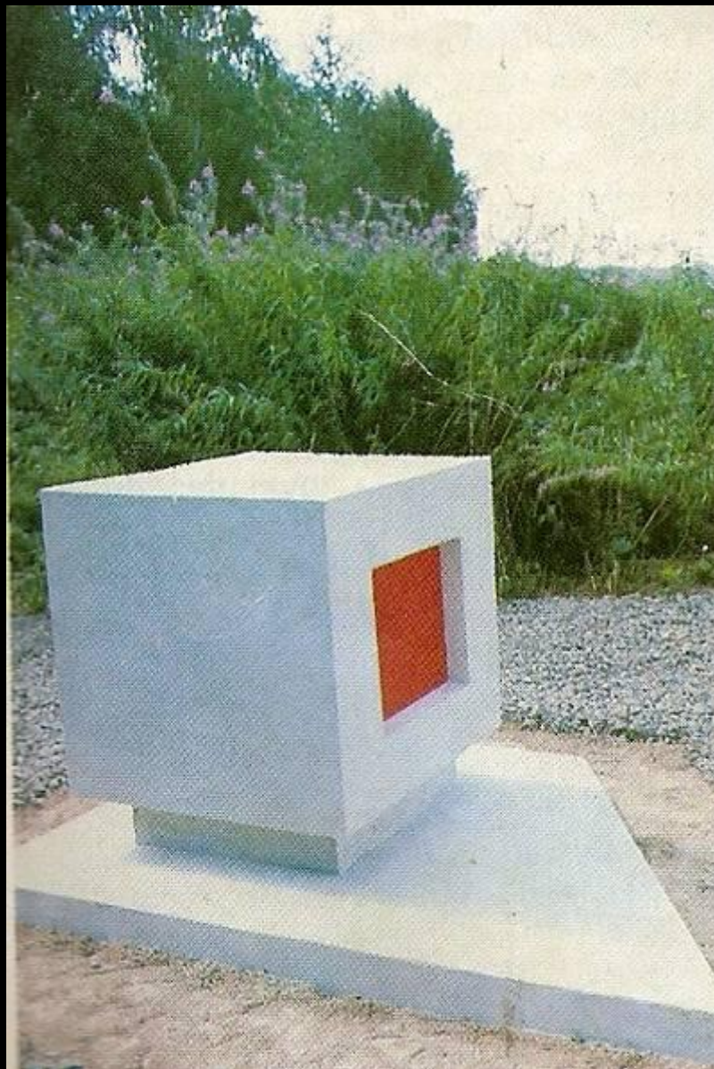
Памятник на могиле К. Малевича