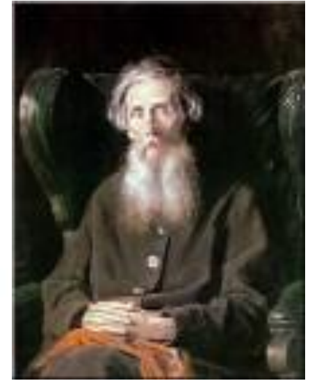
Даль Владимир Иванович