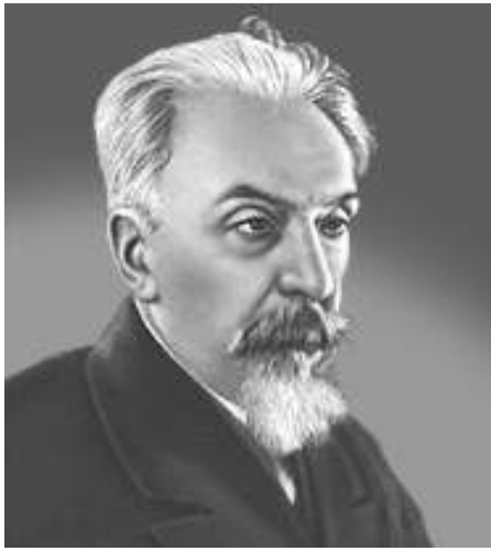
Щерба Лев Владимирович