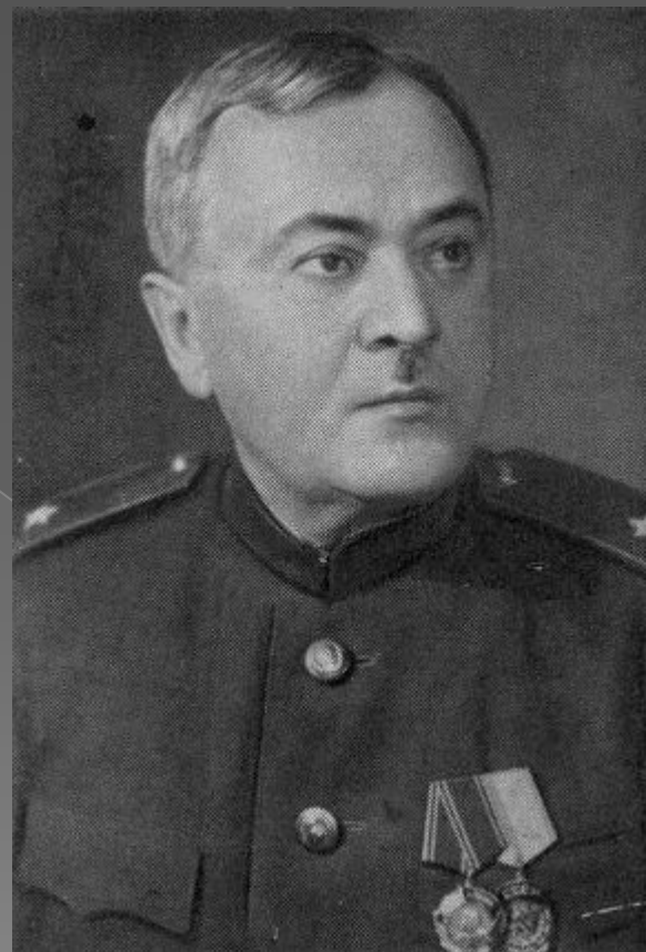
Александр Васильевич Александров