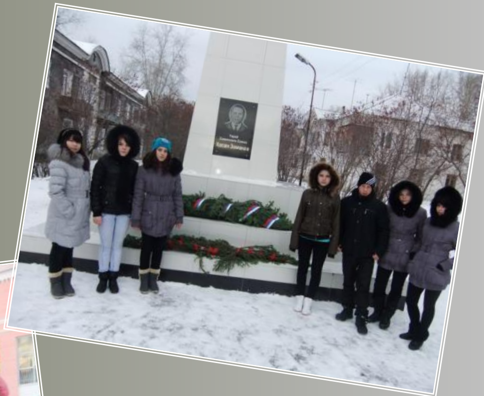
К памятнику Хасана Заманова