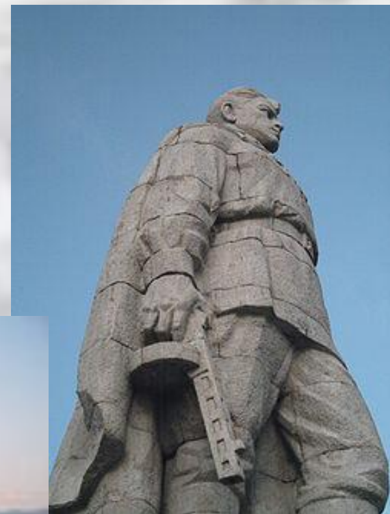
«Алёша». Памятник воину-освободителю в Пловдиве. Болгария