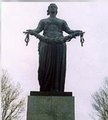
Монумент Родина-Мать на Пискаревском мемориальном кладбище.