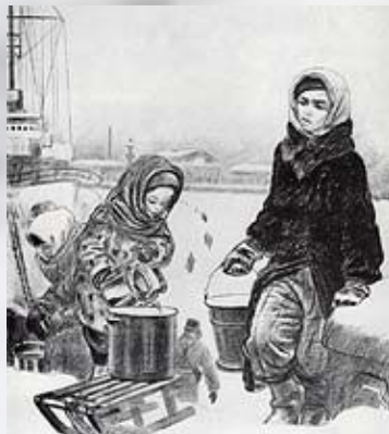
А.Ф. Пахомов из серии «Ленинград в дни блокады.» «За водой».