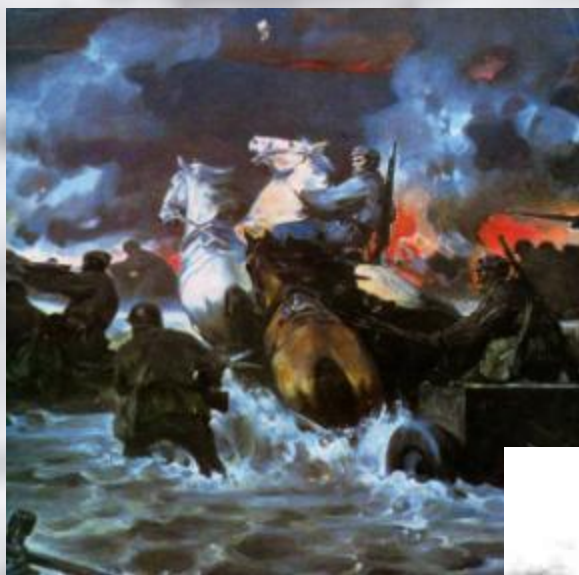
Шаталин В. «Битва за Днепр»