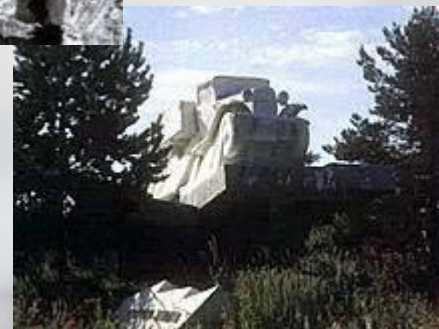
Ладожское озеро. Памятник легендарной «полуторке»