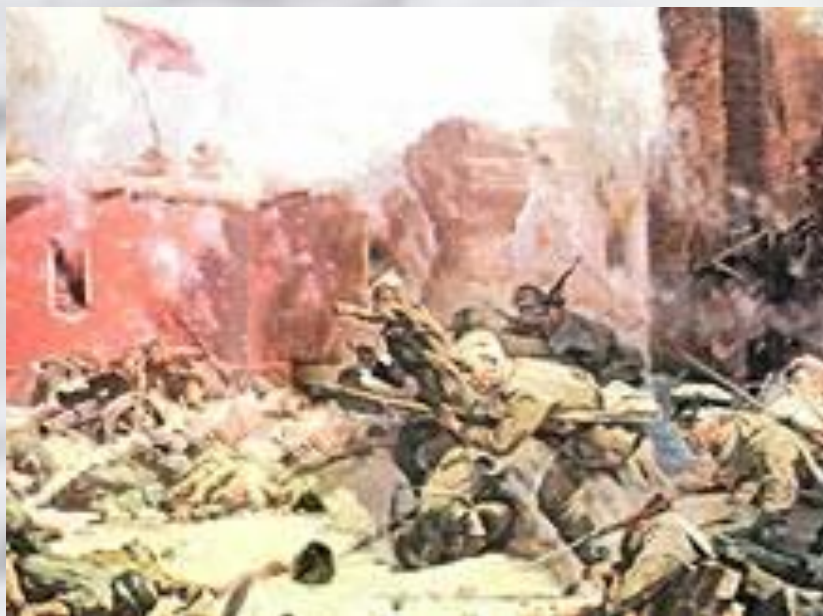
П. А. Кривоногов «Защитники Брестской крепости»