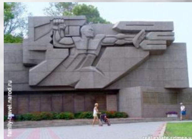
Памятник «Героям штурма Сапун-горы» (1944)