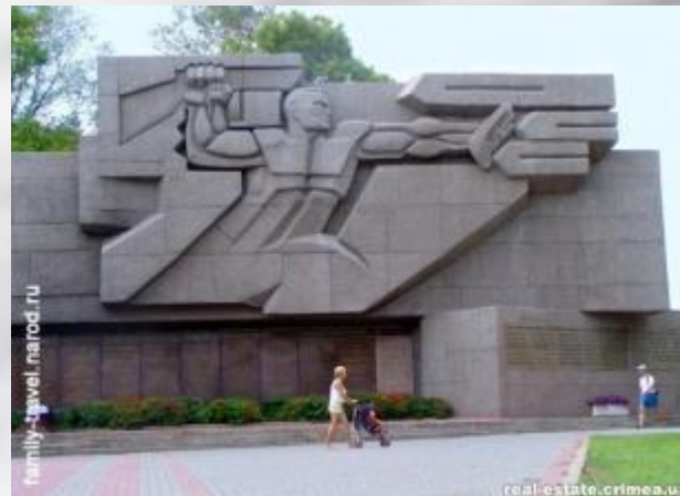
Памятник «Героям штурма Сапун-горы» (1944)