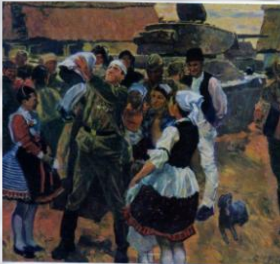
Самсонов М. «В освобожденном селе»