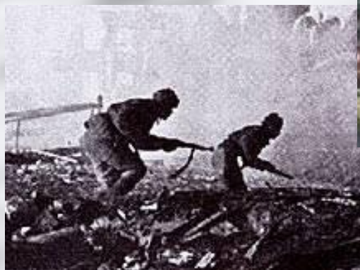
Г. Марченко «На окраине Сталинграда»