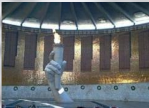
Зал Воинской славы