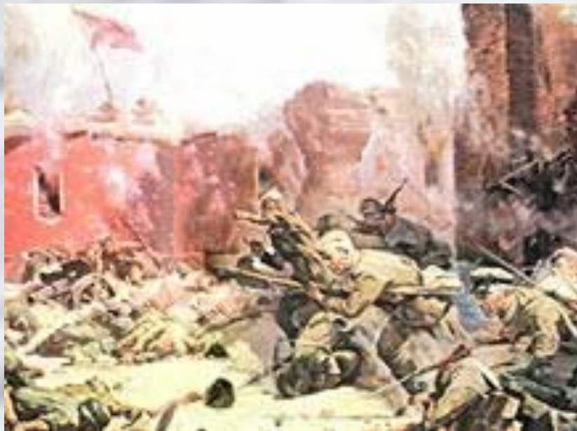
П. А. Кривоногов «Защитники Брестской крепости»