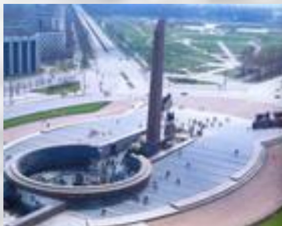
Санкт-Петербург . Площадь Победы скульптура «Блокада» работы М. Аникушина,