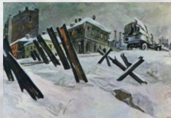
А. Дейнека «Окраина Москвы. Ноябрь 1941 года» (1941)