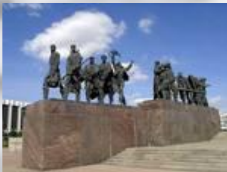
Санкт-Петербург . Монумент защитникам города.