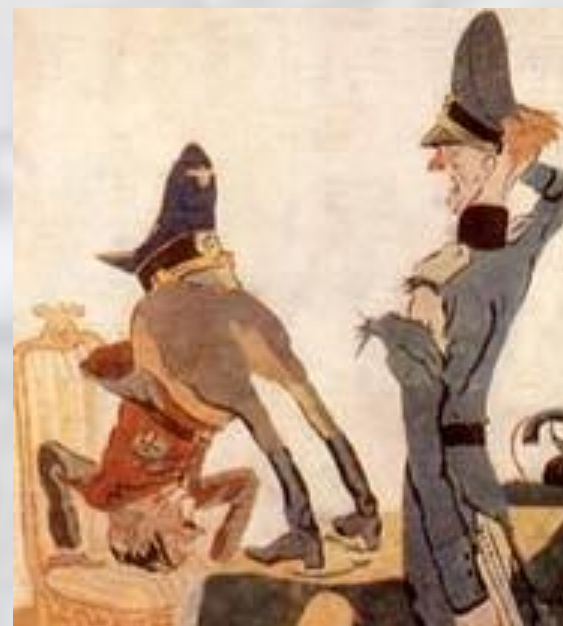
Кукрыниксы. Плакат «На приеме у бесноватого»