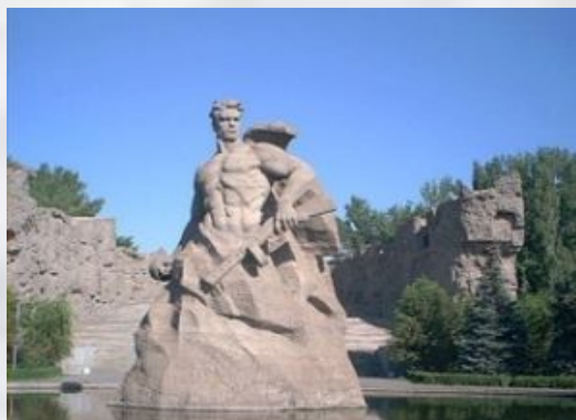
Площадь «Стоявших насмерть!»