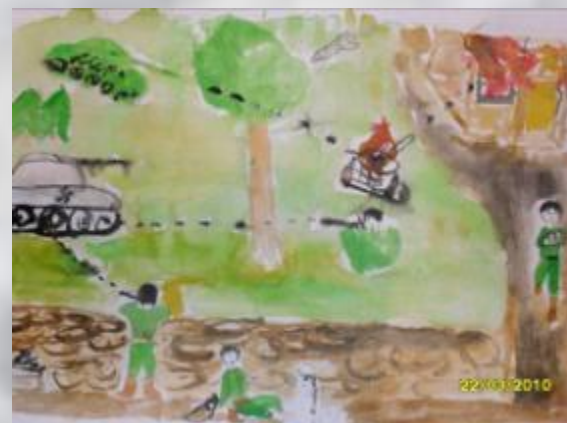
Берг Иван. «Сталинградская битва»