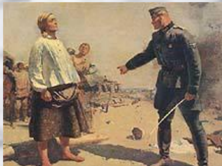
С.В. Герасимова «Мать партизана»