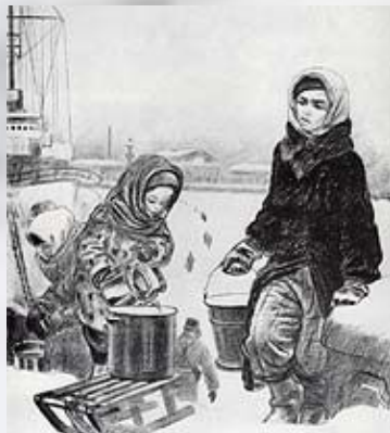
А.Ф. Пахомов из серии «Ленинград в дни блокады.» «За водой».