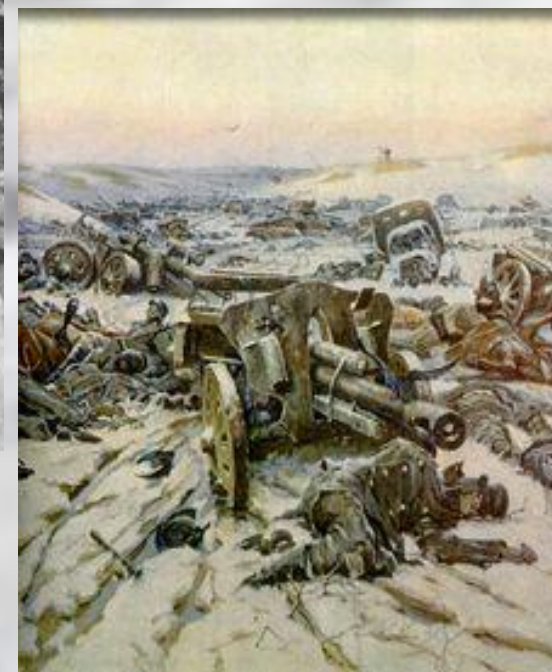
Т.Гапоненко «Корсунь-Шевченковская операция»