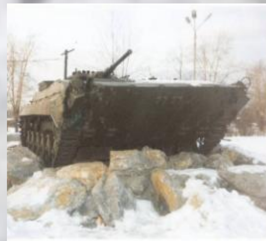
Карпинск. Памятники воинам Великой Отечественной войны