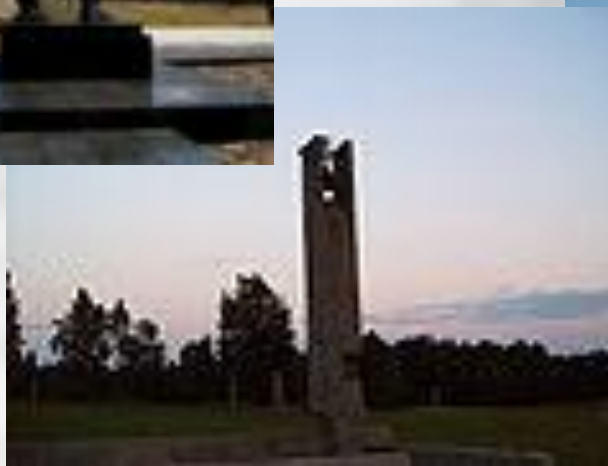
Мемориальный комплекс «Хатынь» в Белоруссии