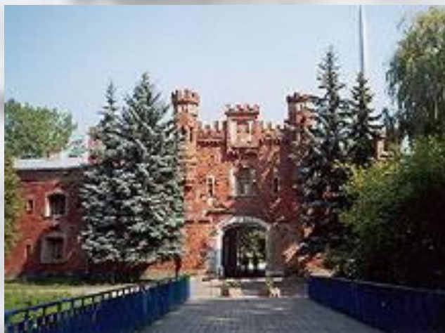
Вход в мемориал «Брестская крепость».