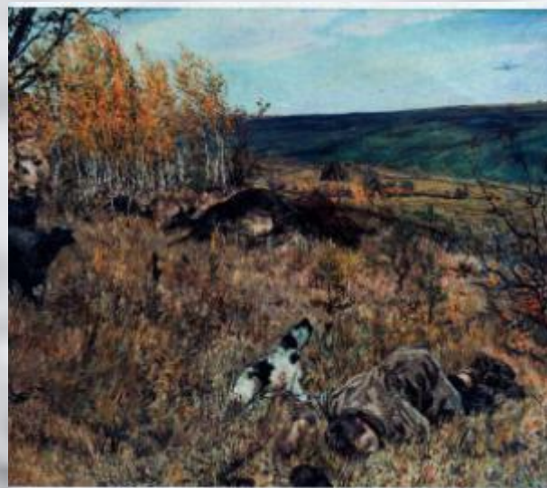
А Пластов. «Фашист пролетел»