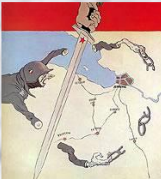
Кукрыниксы. Плакат «Руки коротки»