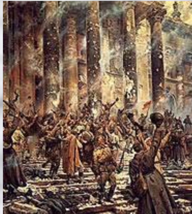
П. А. Кривоногов «Победа»