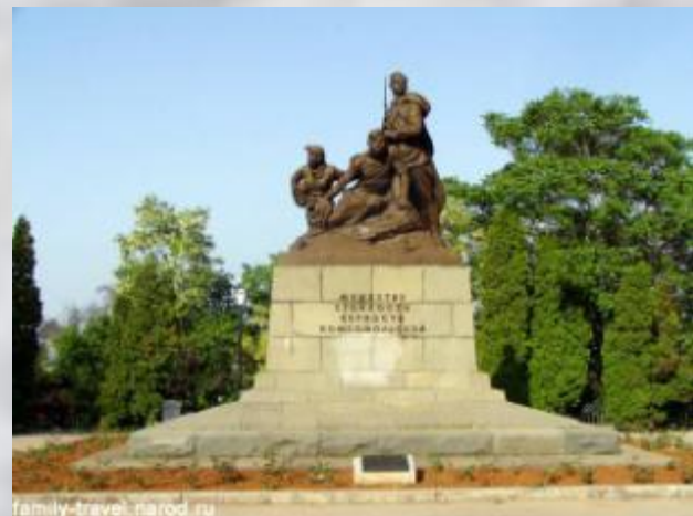
Малахов курган. Филиал музея «Героическая оборона и освобождение Севастополя».