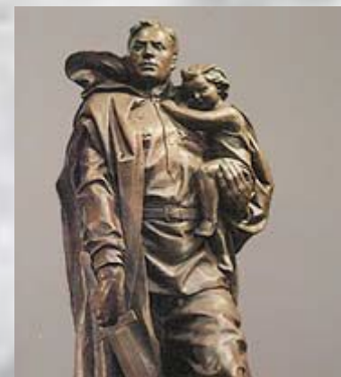
Берлин. Памятник «Советскому воину- освободителю»