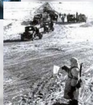
«Дорога жизни» через Ладожское озеро»