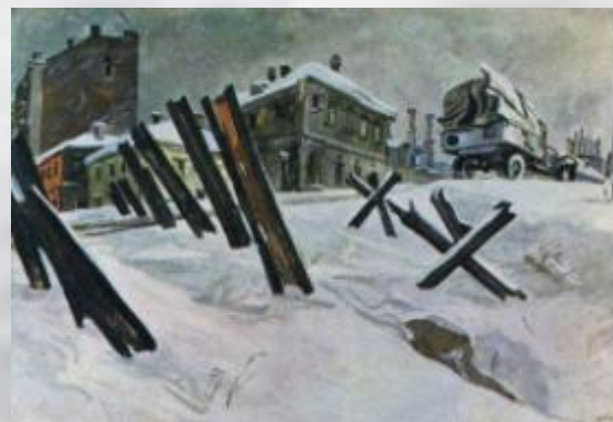
А. Дейнека «Окраина Москвы. Ноябрь 1941 года» (1941)