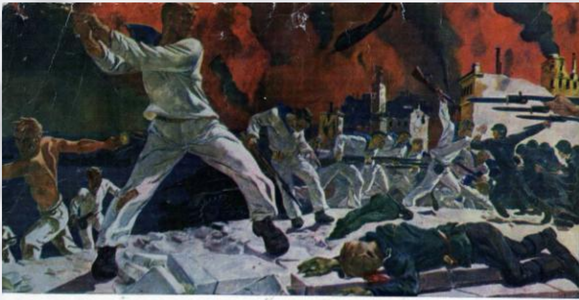
А. А. Дейнека «Оборона Севастополя»