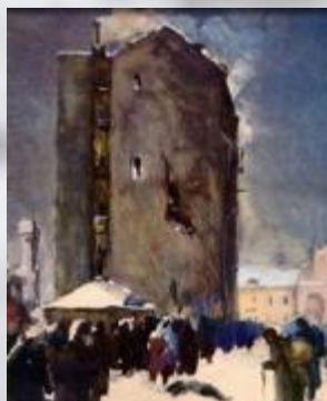
Я.Никоненко. Ленинград. Зима 1941-42 года «Очередь за хлебом»