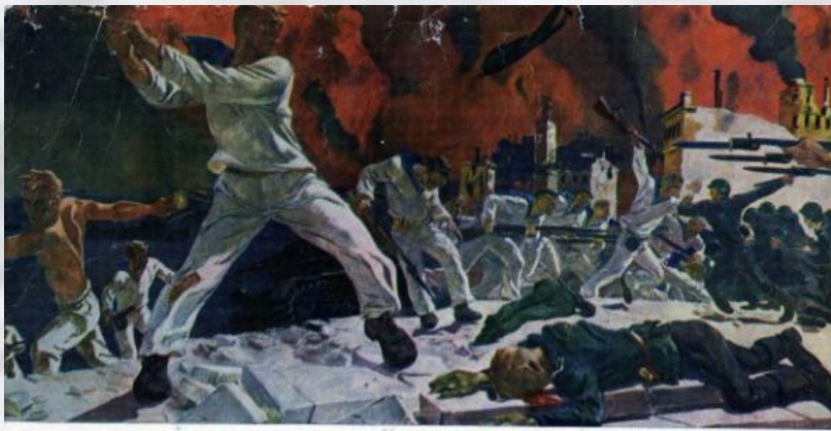
А. А. Дейнека «Оборона Севастополя»