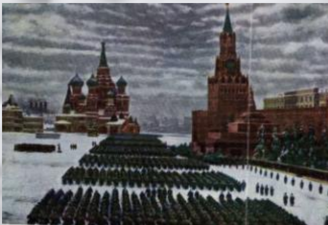
К.Ф. Юон «Парад на Красной площади в Москве 7 ноября 1941 года», (1949)