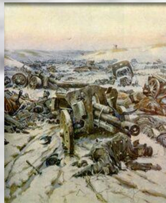
Т.Гапоненко «Корсунь-Шевченковская операция»