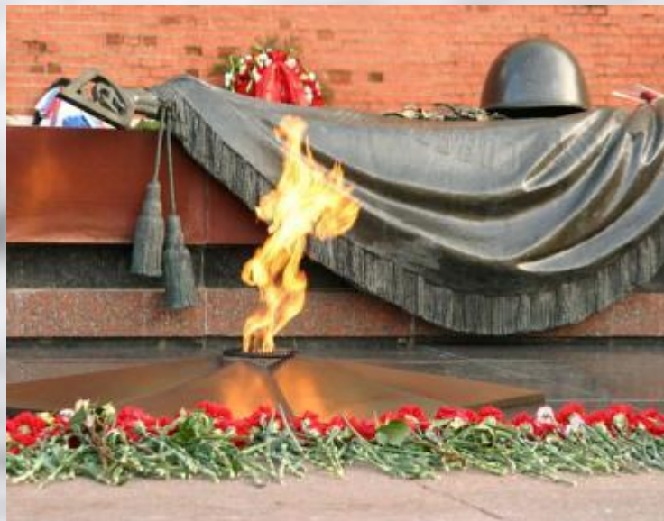
Москва. Могила Неизвестного солдата