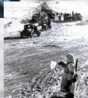
«Дорога жизни» через Ладожское озеро»