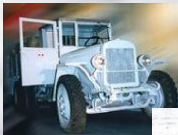
Автомобиль ЗИС-3, доставлявший по «Дороге жизни» грузы в блокированный Ленинград.