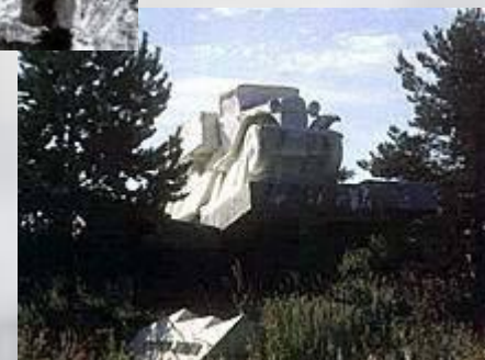
Ладожское озеро. Памятник легендарной «полуторке»