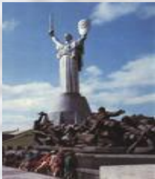
Памятник освободителям Киева