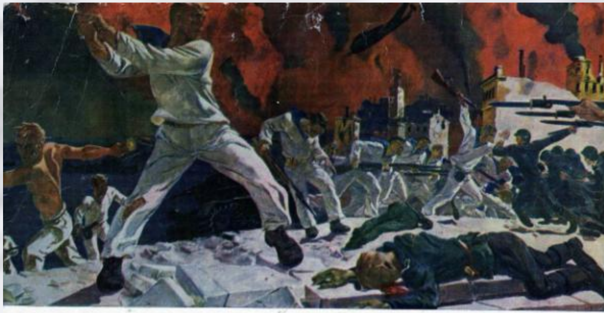
А. А. Дейнека «Оборона Севастополя»