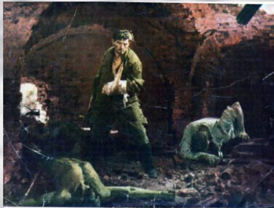
Н. Толкунов «Бессмертие. Брест 1941 года»