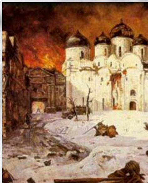
Кукрыниксы. «Бегство фашистов из Новгорода»