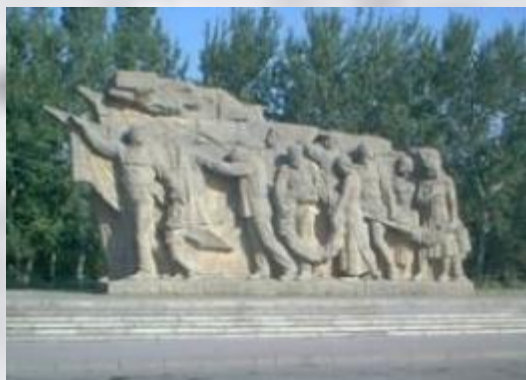
Скульптура «Память поколений»

Мемориальный комплекс героям Сталинградской битвы на Мамаевом кургане. Автор Е. В. Вучетич