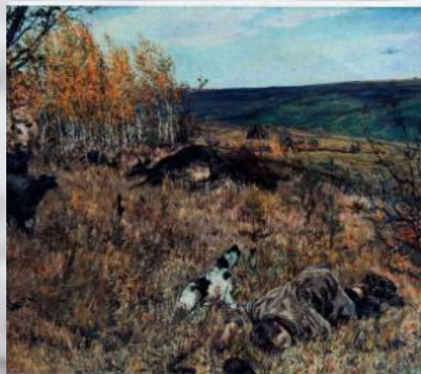
А Пластов. «Фашист пролетел»