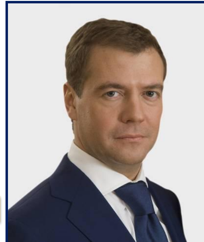
Президент РФ- Медведев Дмитрий Анатольевич