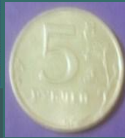
Денежная единица России