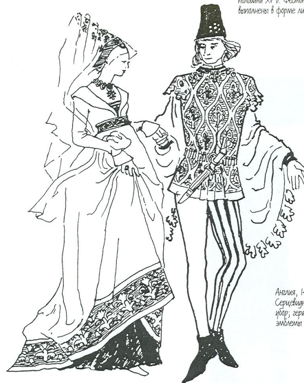
Бургундское придворное платье, первая половина XV в. Фестоны на рукавах выполнены в форме листьев.