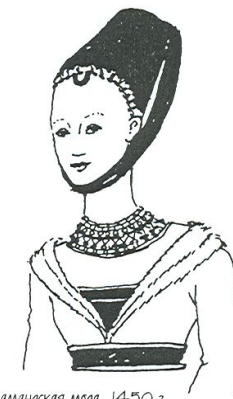
Фламандская мода, 1450 г. Небольшой чепец «геннин» с темным покрывалом.