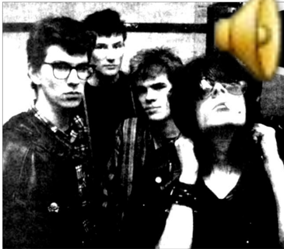
THE SISTERS OF MERCY

Субкультура готы сформировалась вокруг жанра готик-рок, одного из ответвлений новой волны. Основные группы этого жанра сформировались в конце 70-х — начале 80-х. Группы первой волны готик-рока — Sisters of Mercy, Bauhaus, Siouxsie & the Banshees, The Cure, Joy Division — были тесно связаны с панк-роком[3][7]. Однако от панка их отличали существенные музыкальные особенности: более медленный ритм исполнения, меньшая тяжесть, минорная мелодика. Многие группы (например, Sisters of Mercy) использовали драм-машины вместо живых ударных.