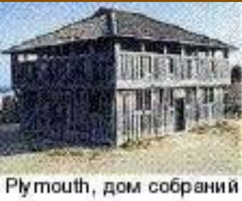
Plymouth, дом собраний