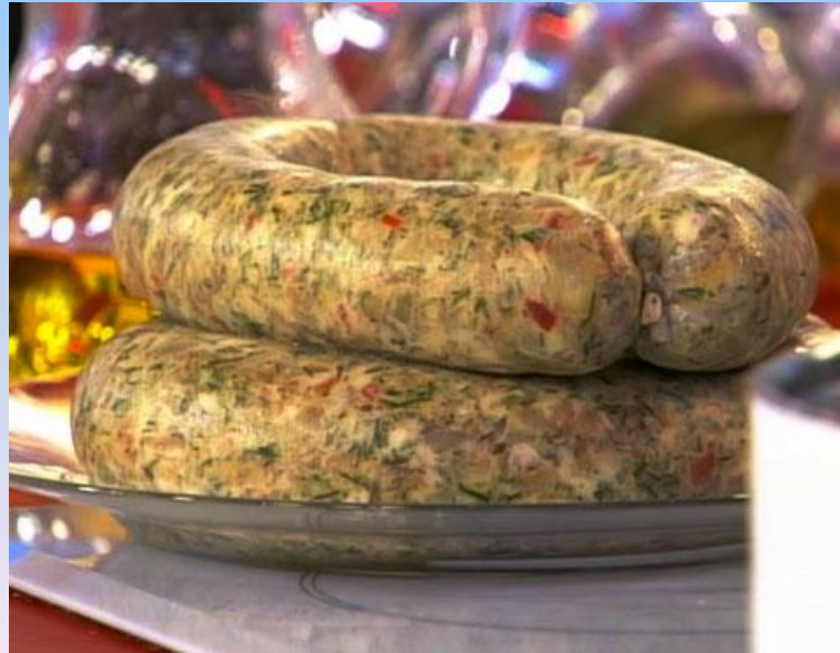
ДОМАШНЯЯ ОТВАРНАЯ КОЛБАСА