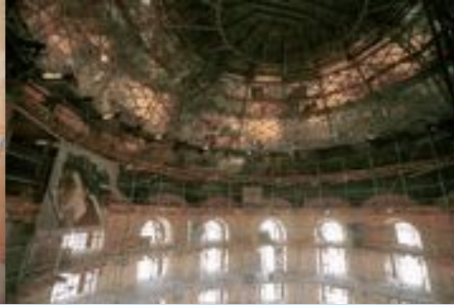
Строительные леса внутри центрального купола, изготовленные на заводе "МИГ" (высота подкупольного пространства около 15 м).