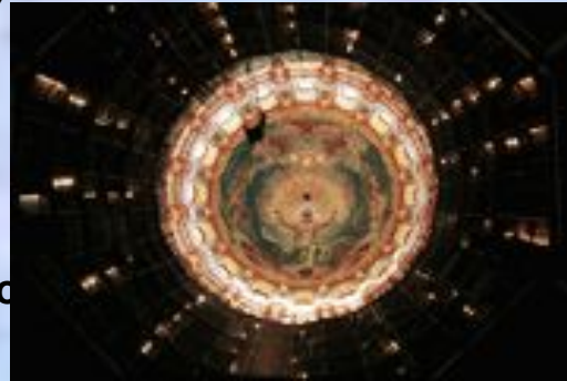
Вид на центральный купол, после снятия верхнего яруса строительных лесов (автор воссоздания Е.Н. Максимов).