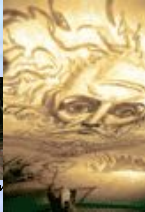
Подготовительный рисунок к росписи центрального купола (автор воссоздания Н. Максимов).