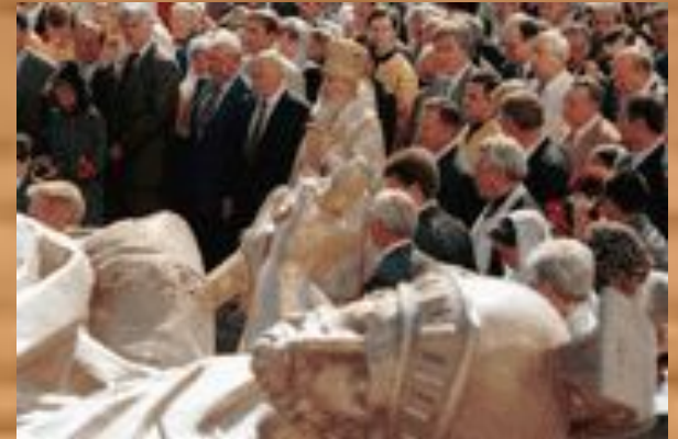
Святейший Патриарх Алексий с членами Правительства Москвы