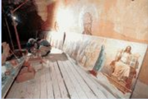
Работа над воссозданием росписи подкупольного барабана (автор воссоздания В.П. Псарев).