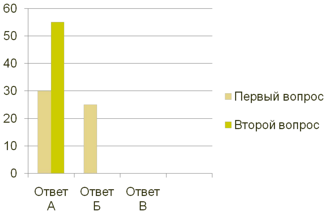
Диаграмма 2. Ответы на вопросы