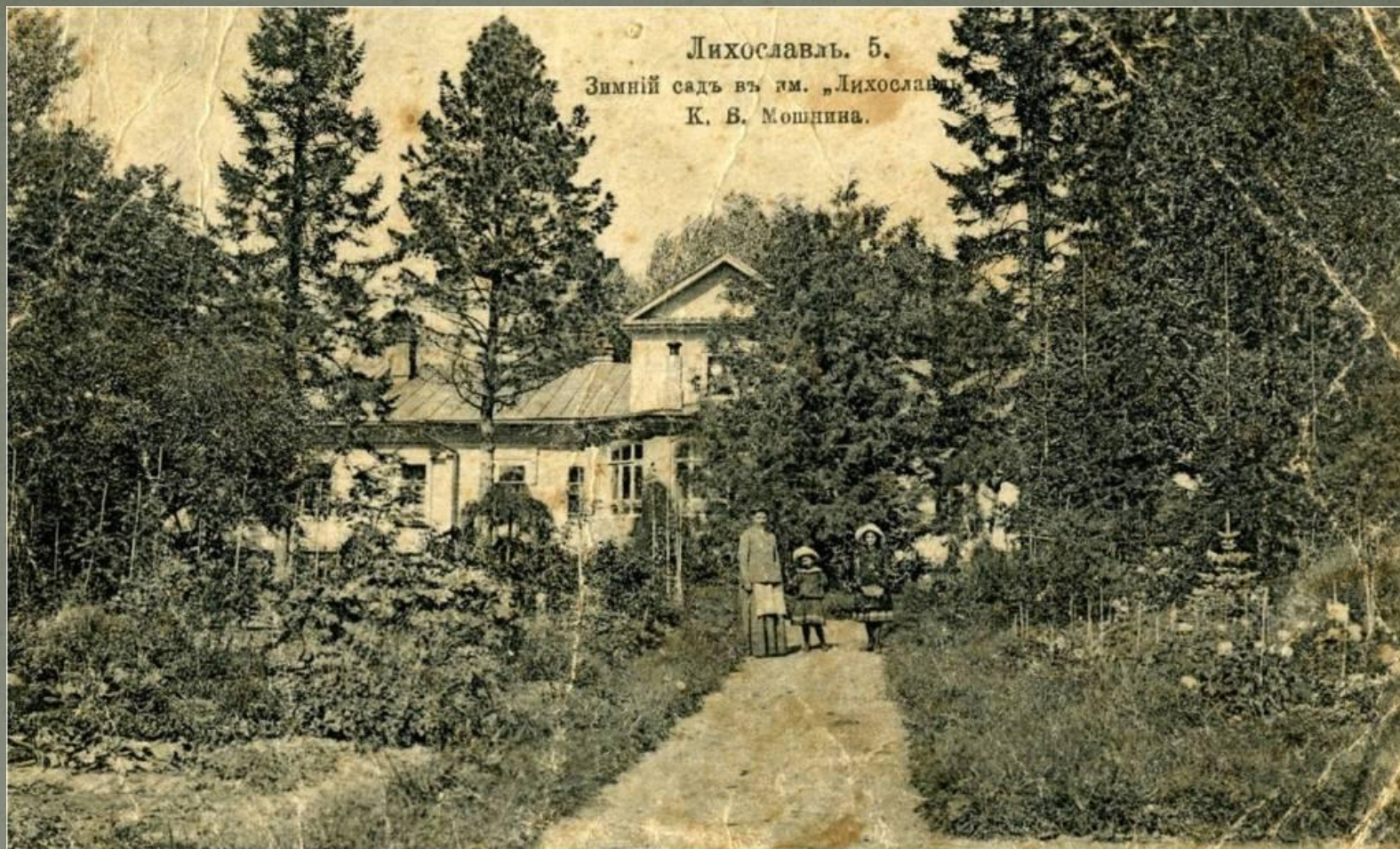
Зимний сад в имении «Лихославль» К.В. Мошнина. (ныне р-н Льнозавода); (конец XIX в.)