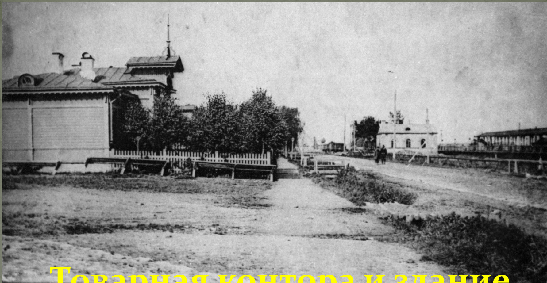
Товарная контора и здание станции Осташково ж/д. 1904 г.