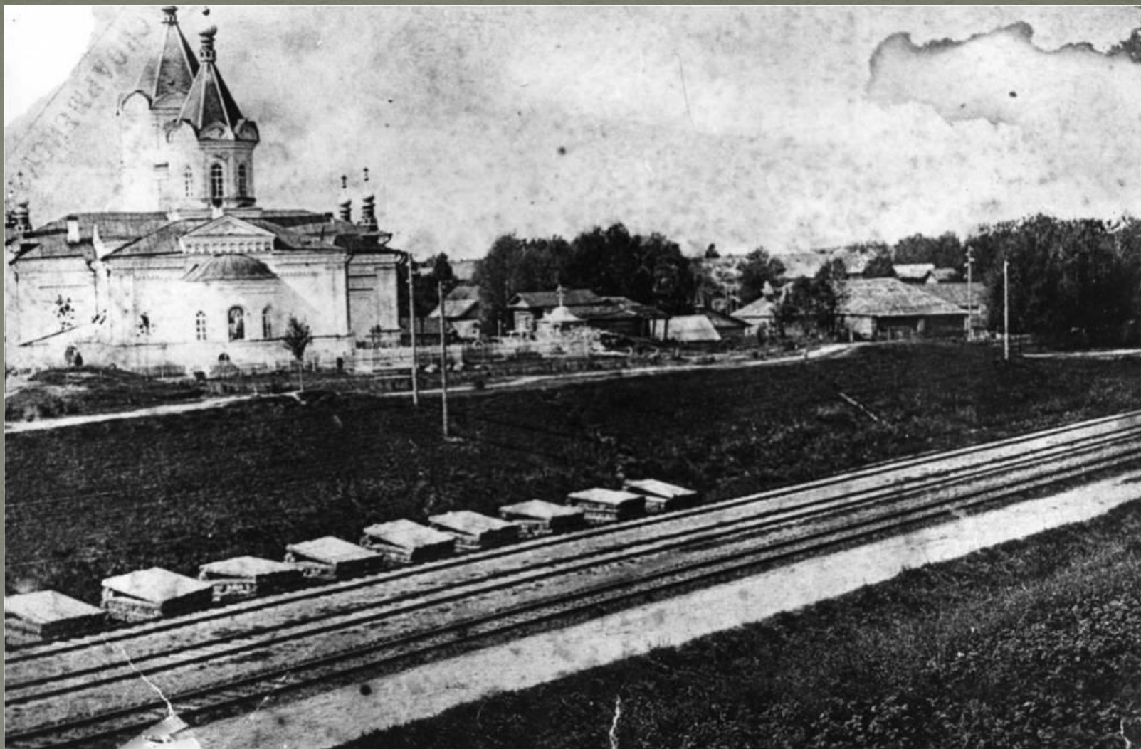
Церковь «Успения Божьей Матери», нач. 20 в.