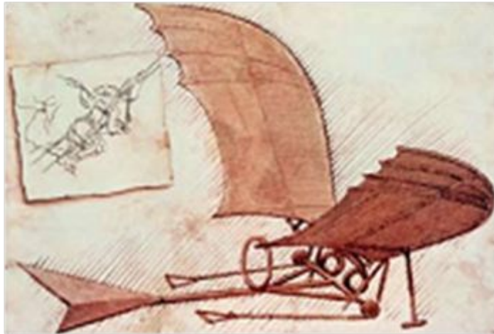
Леонардо да Винчи. Эскизы летательных аппаратов

Гений эпохи Возрождения Леонардо да Винчи уже в XV в. разработал модель летательного аппарата! Его, правда, тогда так и не построили, но чертежи сохранились.