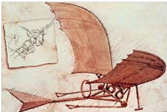
Леонардо да Винчи. Эскизы летательных аппаратов

Гений эпохи Возрождения Леонардо да Винчи уже в XV в. разработал модель летательного аппарата! Его, правда, тогда так и не построили, но чертежи сохранились.