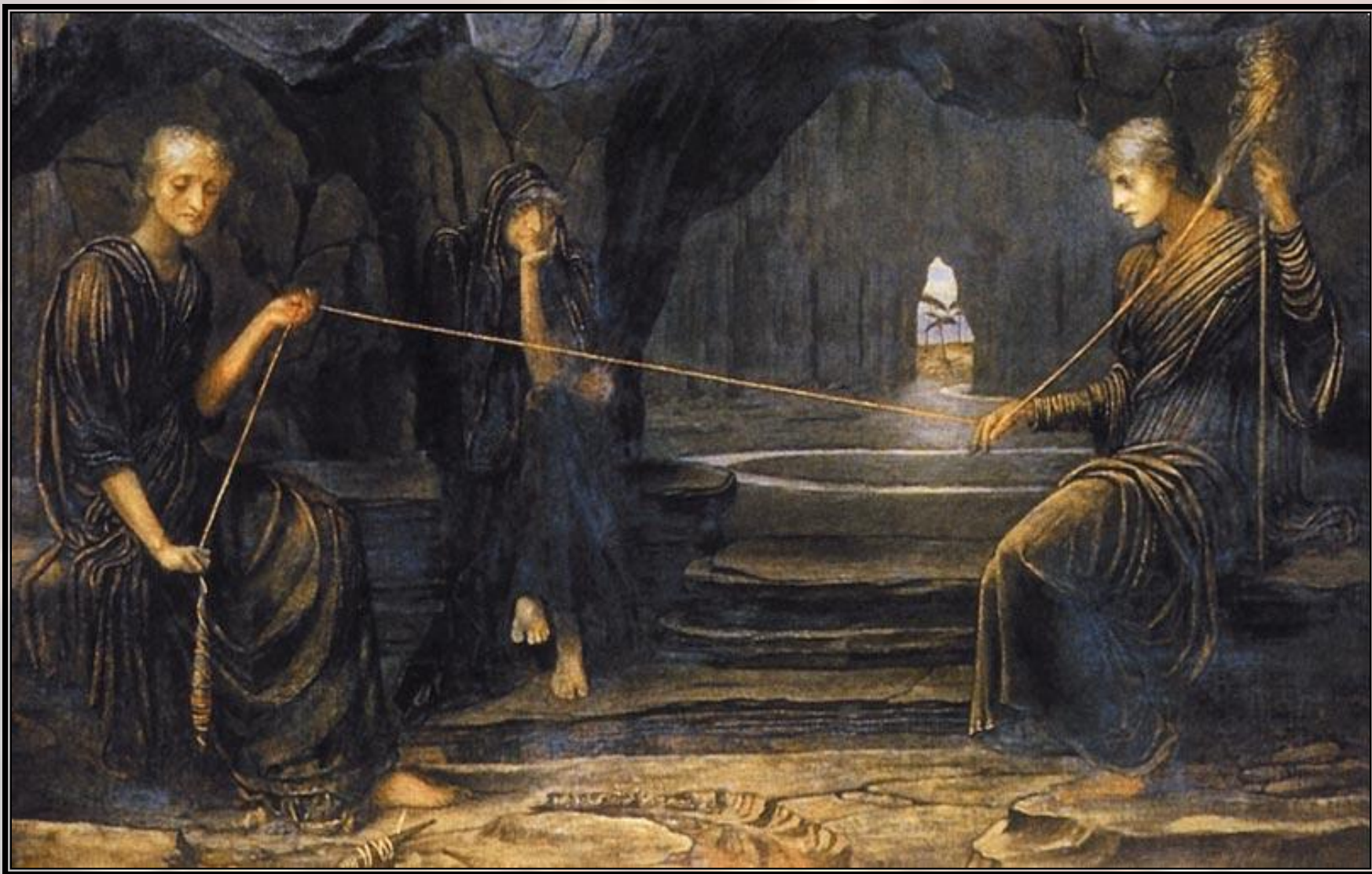
Клото, Лахесис, Атропос