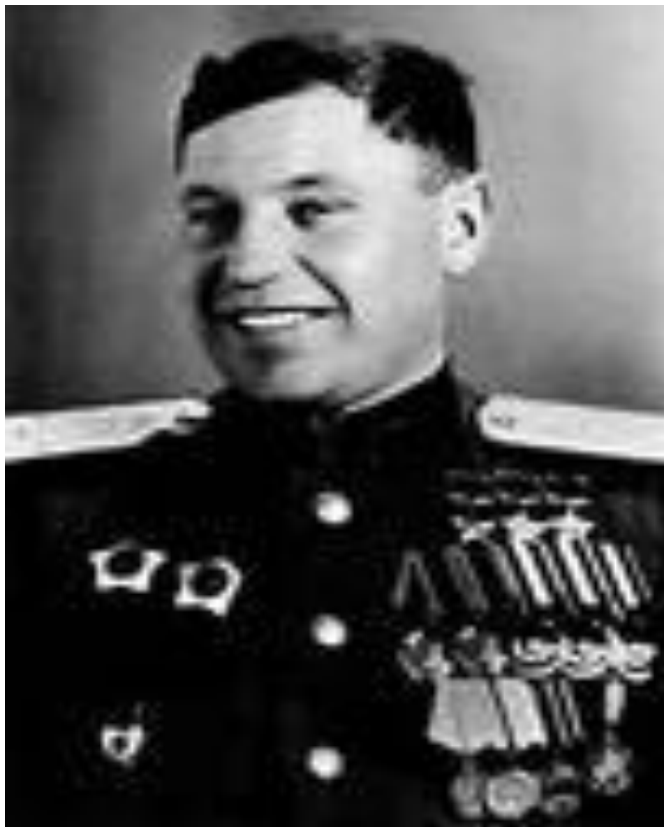
Александр Иванович Покрышкин