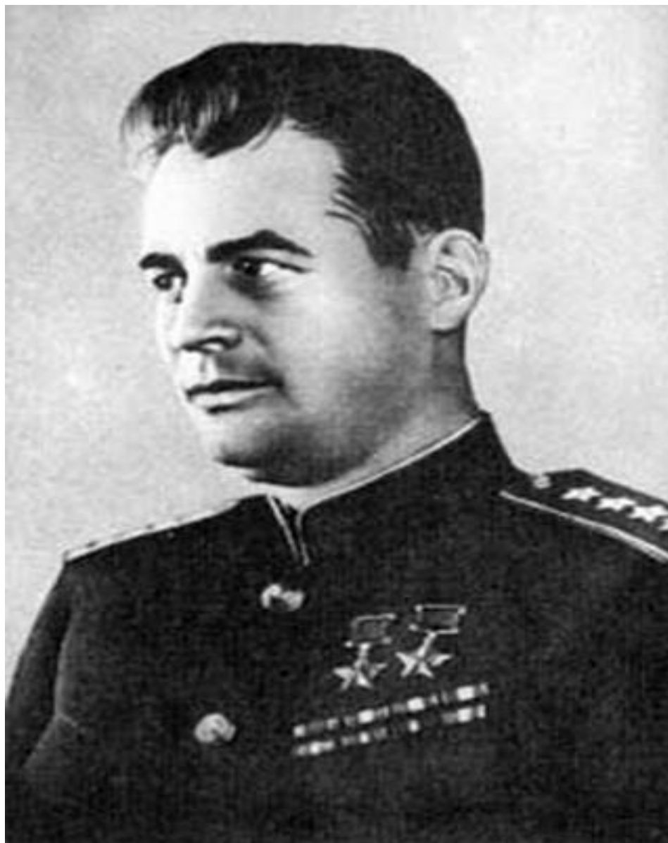
Иван Данилович Черняховский