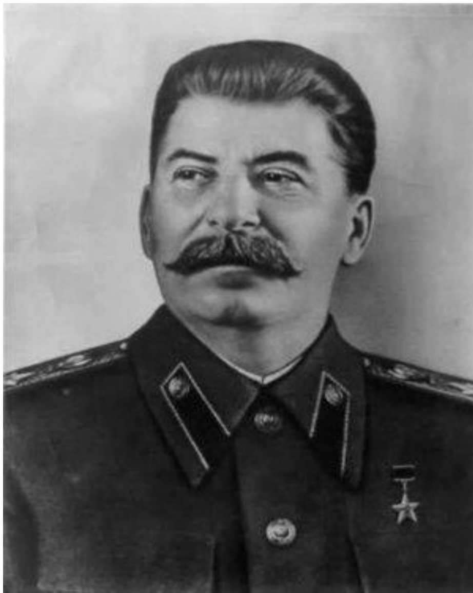
Иосиф Виссарионович Сталин