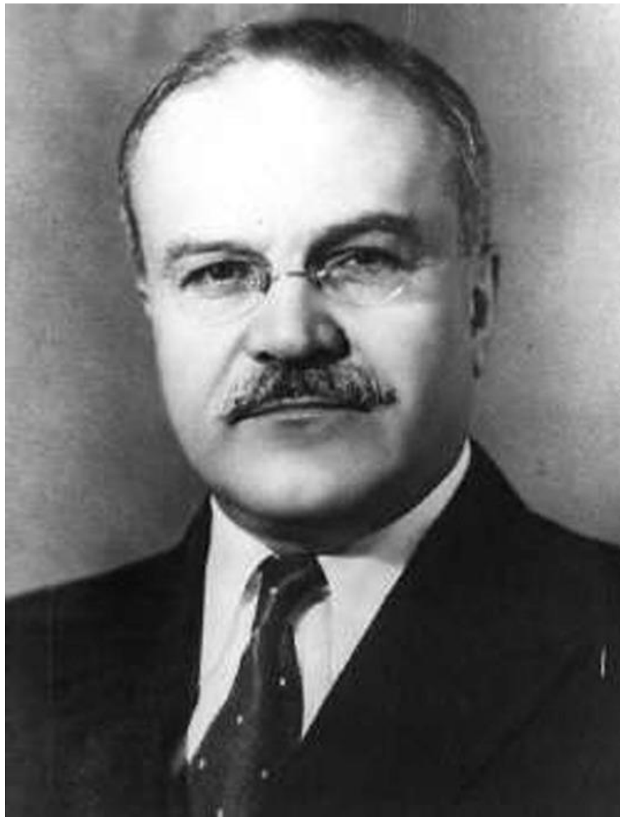
Вячеслав Михайлович Молотов