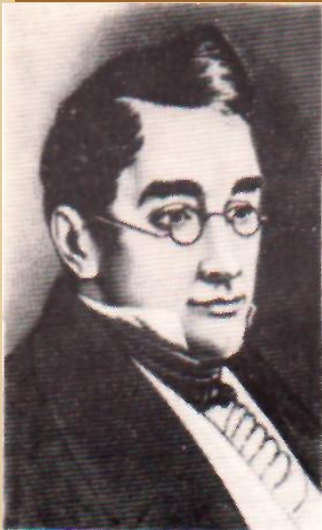
ГРИБОЕДОВ Александр Сергеевич (1795—1829)