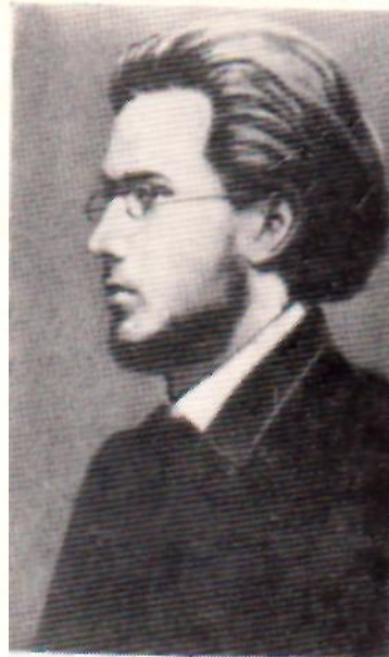
ЛОПАТИН Герман Александрович (1845—1918)

Ставропольцы чтят память о знаменитом своем земляке. Около бывшей гимназии (ныне Высшее военное командное училище связи) будет установлена скульптура Г. А. Лопатина. Пока не найден дом, в котором жил его отец, председатель Казенной Палаты. Но в Октябрьском районе города есть улица, где, по рассказам старожилов, была дача его семьи. Эта улица и носит имя Германа Лопатина.