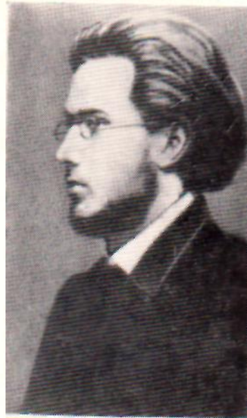
ЛОПАТИН Герман Александрович (1845—1918)

Ставропольцы чтят память о знаменитом своем земляке. Около бывшей гимназии (ныне Высшее военное командное училище связи) будет установлена скульптура Г. А. Лопатина. Пока не найден дом, в котором жил его отец, председатель Казенной Палаты. Но в Октябрьском районе города есть улица, где, по рассказам старожилов, была дача его семьи. Эта улица и носит имя Германа Лопатина.