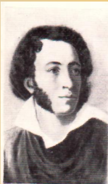
ПУШКИН Александр Сергеевич (1799—1837)