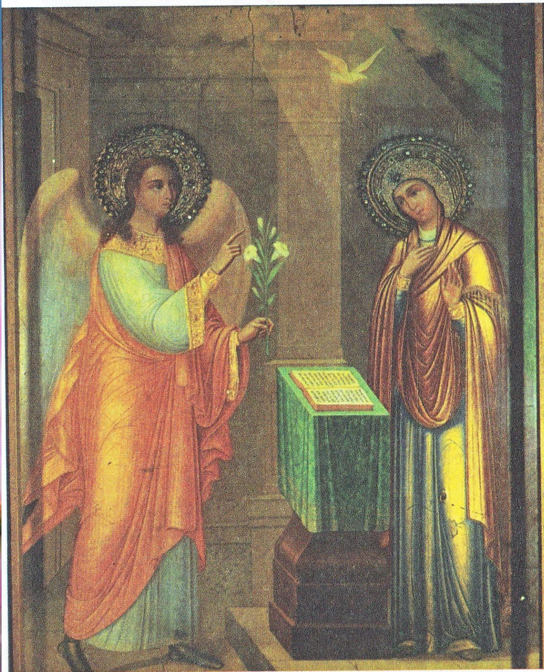
Благовещение Пресвятой Богородицы. Икона