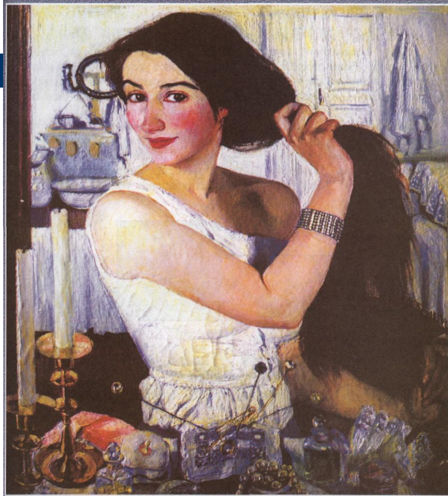
З. Е. Серебрякова (1884—1967). За туалетом. Автопортрет. 1909 г. ГТГ