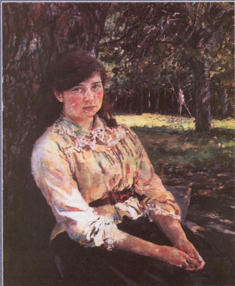
В. А. Серов (1865—1911). Девушка, освещенная солнцем. 1888 г. ГТГ