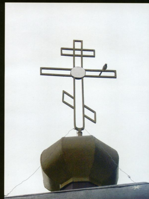
Крест Южного храма. Ранее был установлен над Средним храмом. Во время разрушения монастыря в начале XX века перенесен в южный храм Большого монастыря. The Cross from South church. Earlier it was put on the Middle church. During the riot in the monastery it was shot with bullets by Bolsheviks.