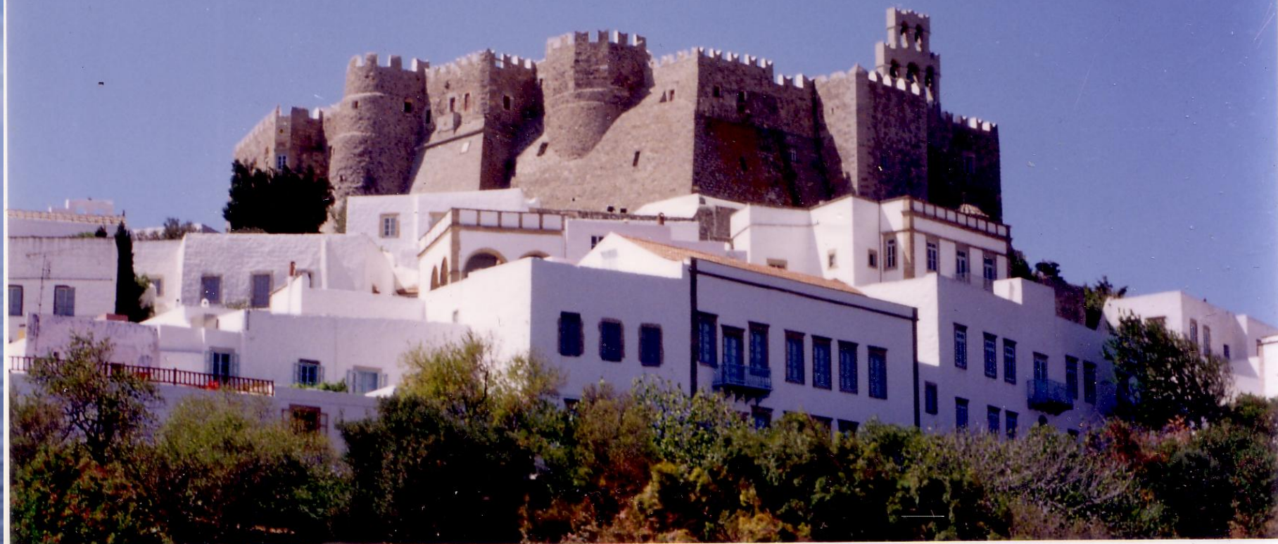
Монастырь Иоанна Богослова на острове Патмос