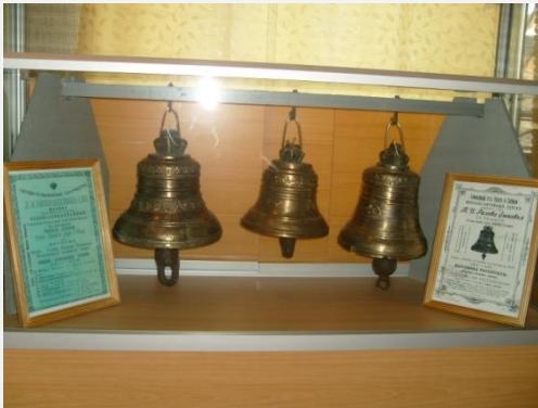
Из коллекции колокольчиков