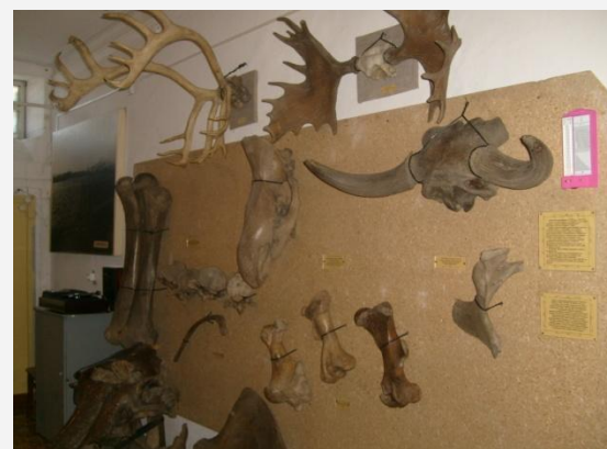
Фрагменты скелета мамонта