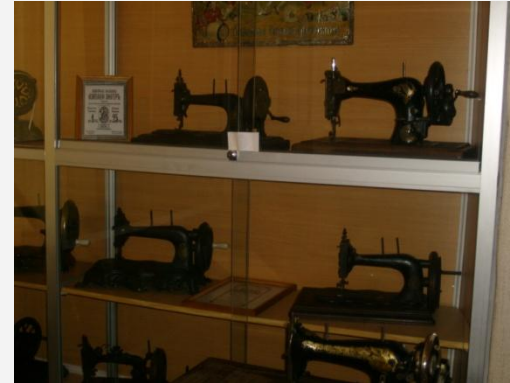
Из коллекции швейных машинок