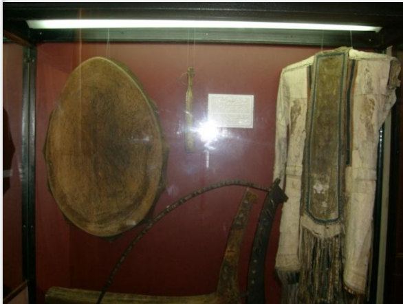
Бубен и колотушка мантийского шамана