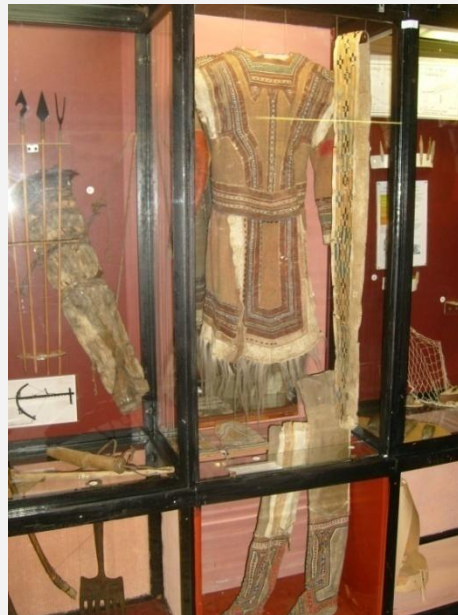
Одежда мантийского шамана