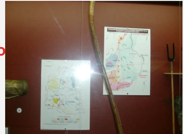
Лук, стрела, колчан охотников манси