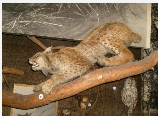
Рысь –представитель лесной зоны Урала