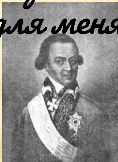
Абрам Петрович Ганнибал, прадед Александра Сергеевича Пушкина. ( портрет написан около 1790 г )

«Там некогда гулял и я: Но вреден север для меня...»