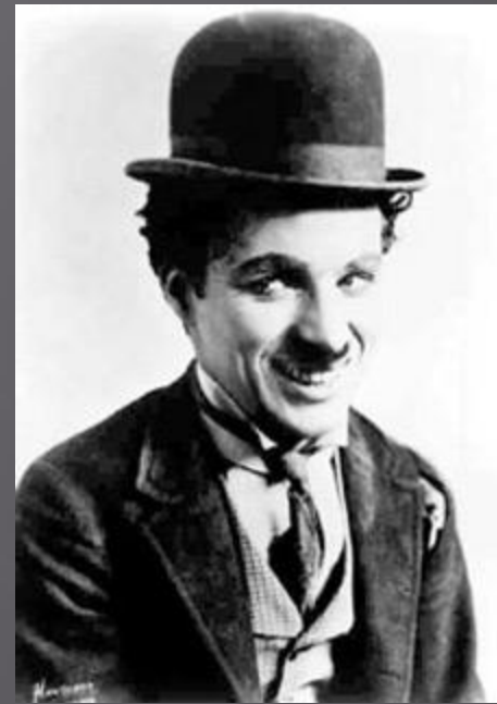
▣ Чарльз Спенсер Чаплин