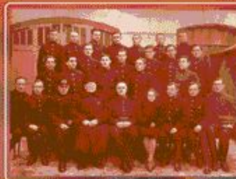
Первый выпуск Ленинградского пожарного техникума

Образована Академия государственной противопожарной службы.