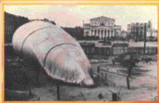
■ Прифронтовая Москва.

Суровые испытания выдвали на подразделения пожарной охраны в годы Великой Отечественной войны. Проявляя чудеса стойкости и героизма, они сорвали планы фашистов по превращению наших городов в вылающие костры. Тысячи пожарных за свои подвиги были награждены боевыми орденами и медалями.