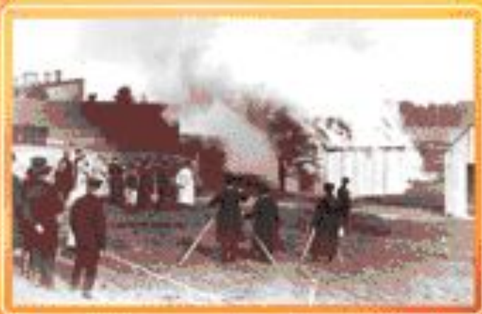
■ Испытания новых пожарных средств. Начало XX в.

Основу кадрового обеспечения Государственной противопожарной службы составляет система пожарно-технических учебных учреждений.