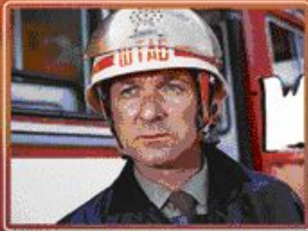
■ Кадр из фильма «Тревожное воскресенье».

От специальных изданий до художественной литературы, кино, театра, музыки простирается сфера деятельности противопожарной пропаганды, стремящейся найти пути к уму и сердцу каждого человека.