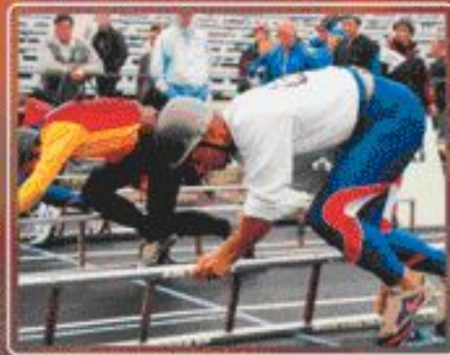
■ Команды на старте.