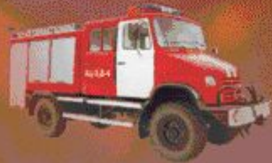
■ Современная автоцистерна.

При тушении лесных пожаров с успехом применяется авиация.