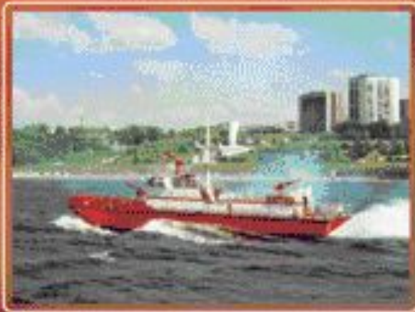
■ Тревога на пожарном судне.

Пожарная охрана России располагает разнообразной современной пожарной техникой, позволяющей успешно бороться с пожарами любой сложности.