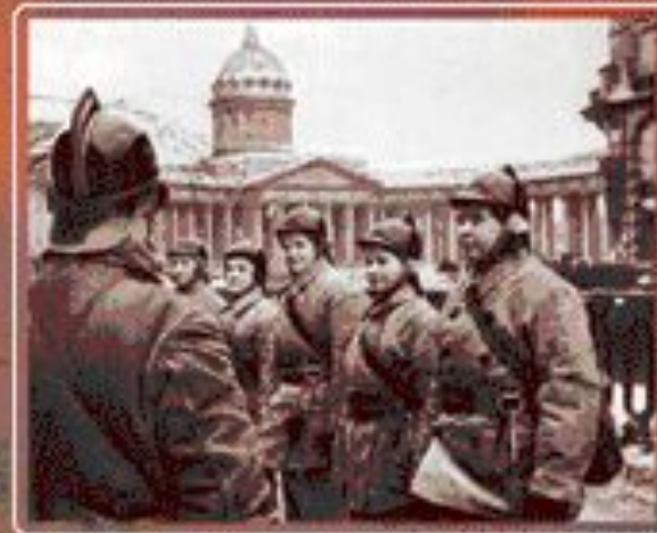
■ Бойцы Комсомольского противопожарного полка.

Многие огнеборцы пали в огне военных пожаров, многие не вернулись с фронтов. Но никто не забыт и ничто не забыто!