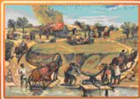
■ Тушение пожара. Плакат 1930-е годы.