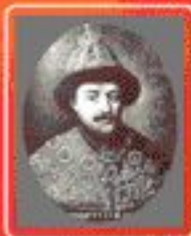
■ Царь Алексей Михайлович (1645-1676).

17 апреля издан Декрет Совнаркома «Об организации государственных мер борьбы с огнем», положивший начало современной российской пожарной охране.