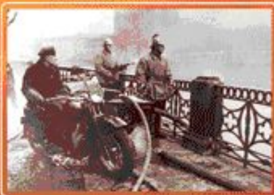
■ Пожарный мотоцикл в блокадном Ленинграде.

Указом Президиума Верховного Совета СССР пожарная охрана г. Москвы награждена орденом Ленина.