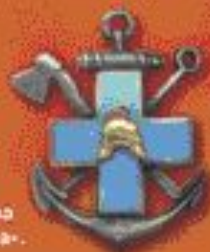
■ Знак «Общества голубого креста».