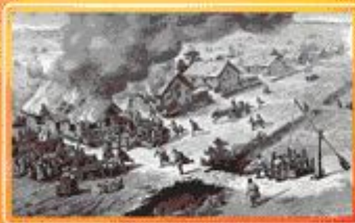
■ Пожар в сельской местности.

По мере становления российской государственности, принимались меры для борьбы с пожарами, которые становились серьезным препятствием для экономического развития страны.