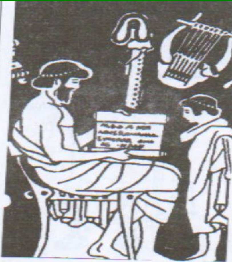
В греческой школе, с аттической краснофигурной вазы

Для древних греков учеба очень приятное и полезное занятие. Под досугом они представляли не безделье, а беседы мудрецов – философов со своими учениками о разных науках. Вначале проводились беседы, но позднее появились самые настоящие занятия.